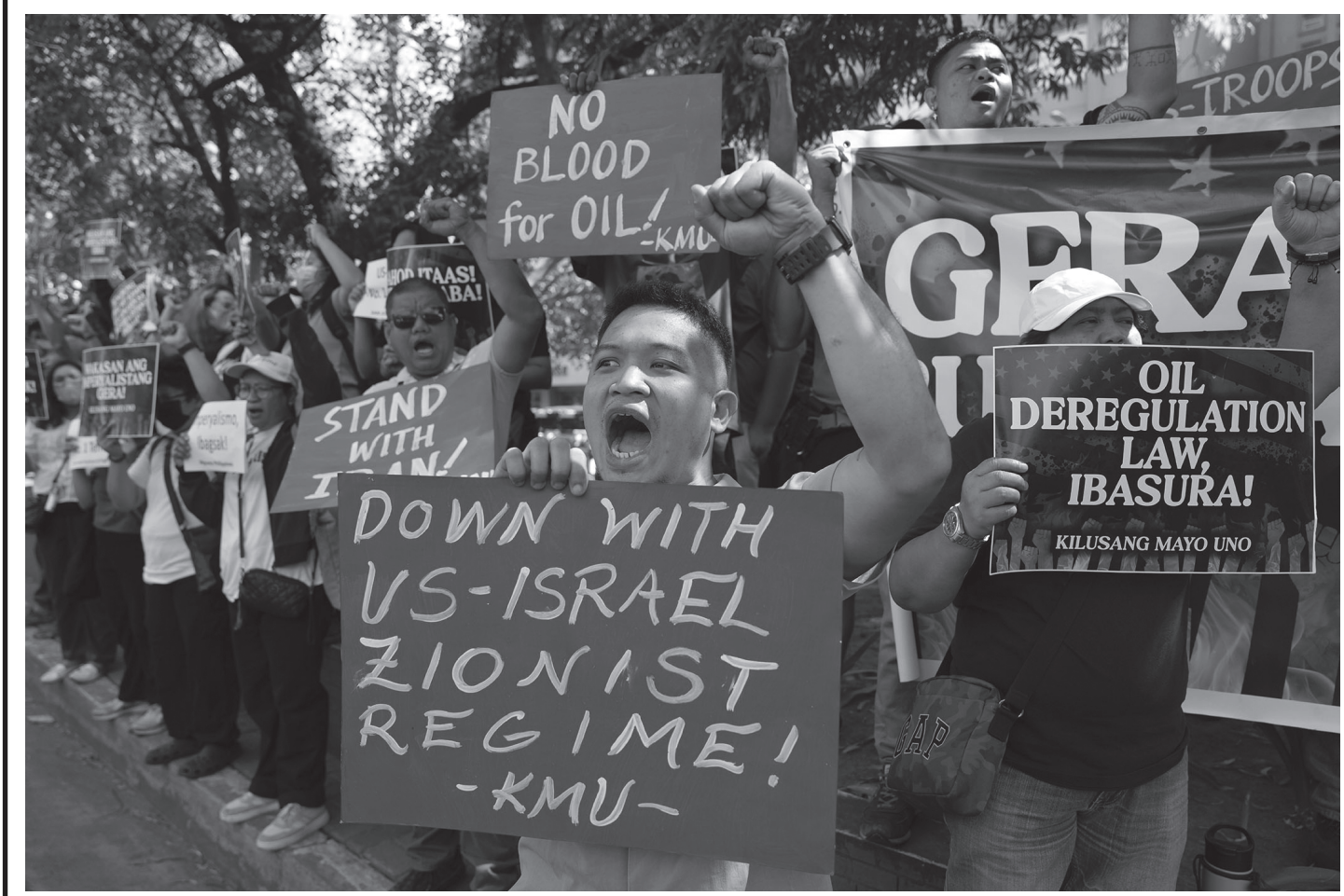
दक्षिणपूर्वी एसियाली देश फिलिपिन्सको राजधानी मनिलास्थित अमेरिकी राजदूतावासअगाडि मध्यपूर्वको युद्ध अन्त्य गर्न माग गर्दै 'तेलको निमित्त रगत बगाउन छोड' भन्ने नारा लगाउँदै प्रदर्शनरत युवाहरू मार्च २३, २०२६ का दिन।