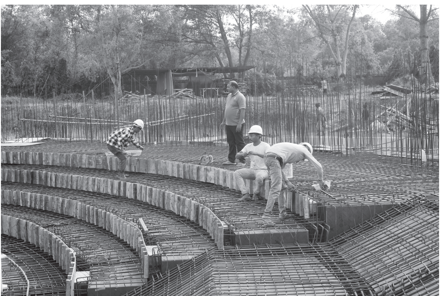
निर्माणाधीन विश्व शान्ति धाम भवन

नियमित उडान सुरु भएसँगै विशेषगरी बिरामी बोकेर बाहिर लैजानुपर्ने बाध्यता भेलिरहेका स्थानीयलाई ठुलो राहत मिल्ने अपेक्षा गरिएको छ ।