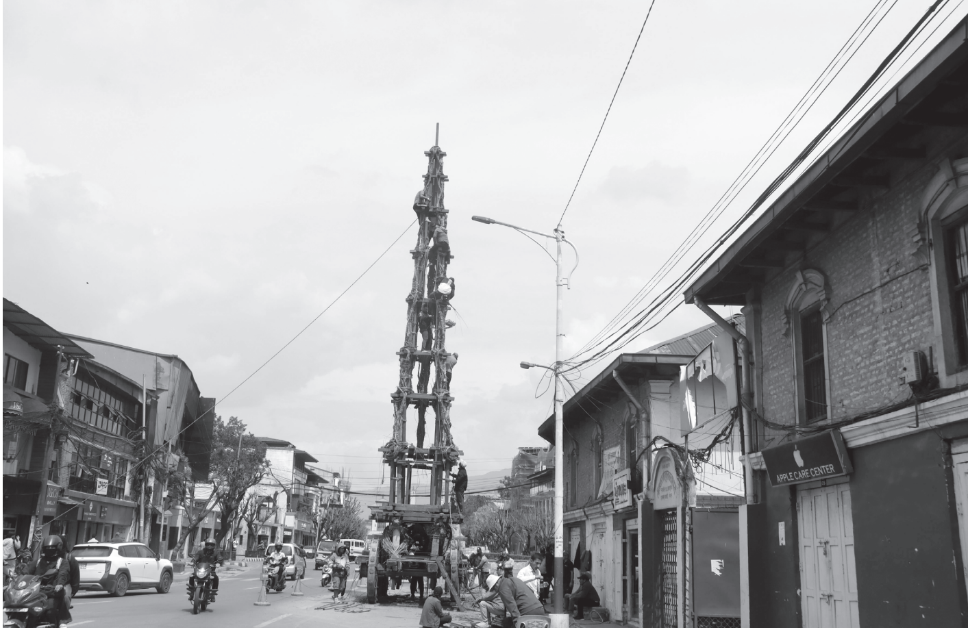
सेतो मच्छिन्द्रनाथको रथ निर्माण गरिँदै : काठमाडौंको दरबारमार्गस्थित तीनधारा पाठशालामा सोमबार वर्षा र सहकालका देवता सेतो मच्छिन्द्रनाथको रथ निर्माण गरिँदै ।