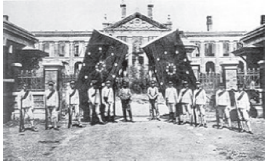
उच्छाङ विद्रोहको भूमिगत मुख्यालय

संरक्षित क्षेत्रको रूपमा 'प्रदान' (Concessions) गराए।