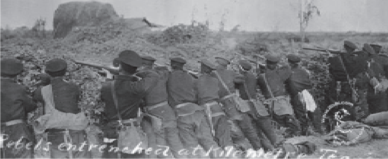
हान्कोको युद्धमोर्चामा क्रान्तिकारी सेनाहरू

हुनान प्रान्तमा १९०९ मा बाढी र सुख्खाले गरिब किसानहरू घाँस र भ्याकुरजस्ता कन्दमूल खाएर बाँच्दै थिए भने जमिनदारहरू, लोभी साहुमहाजन र विदेशी व्यवसायीहरू महँगोमा अन्न बेच्न सामान लुकाउँदै थिए। दुई हजार जाने अन्नलाई ९ हजार मूल्यमा बेच्न खोज्दा हुनानको प्रान्तीय राजधानी चाङशांका अञ्चलाधीशलाई जनताले मूल्य घटाउन निवेदन दिए। तर, अञ्चलाधीशले गोली चलाउने आदेश दियो र दर्जनौँ मानिसहरू मारिए र सयौँ घाइते भए। रिसाएका भोका जनताले गोदामहरूमा धावा बोले र सयौँ पसलहरू फोरे तथा अञ्चलाधीशको निवासमा आगो लगाए, राष्ट्र बैङ्क र जापानी महावाणिज्य दूतावासमा पनि आगो लगाइदिए। देशी र विदेशी संयुक्त सेनाले भोका नाङ्गा जनतालाई दबाउन थाल्यो। त्यसको परिणाम जनताको विद्रोह चर्क्यो।