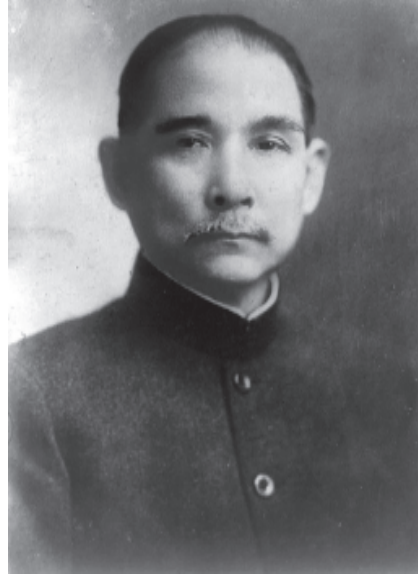
डा. सन यात सेन

सन यात-सेन शाङ्घाई र थेनचिनमा गएर लि हुङ छाङको बारेमा बुझेर भेट्न चाहे। त्यहाँ ऊ विदेशीहरूको हितमा काम गर्ने र सामन्ती भूमिपतिहरूको शासनको पक्षमा देखे र उसले भेट्न पनि चाहेन। पेइचिङमा गएर सन यात सेनले छिड सरकार पुरै विदेशको भरमा र पुरानै ढङ्गले शासन चलाएको देखे। उनको मनमा पर्यो, "राजनैतिक सुधार असम्भव छ। सुधारवाद एक बन्द गल्ली हो। छिड सरकारलाई हटाउने एउटै उपाय छ - सशस्त्र सङ्घर्ष।"