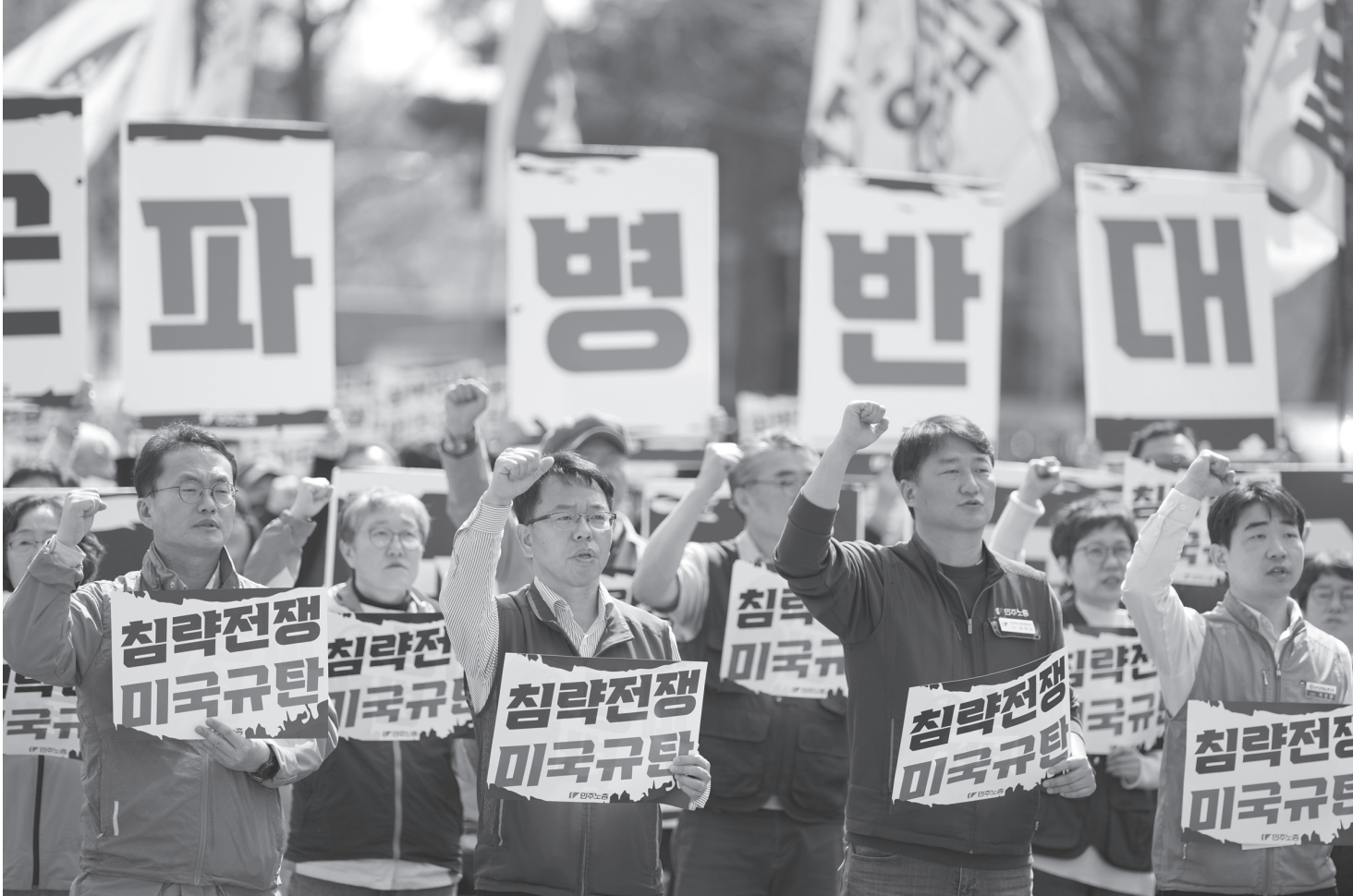
दक्षिण कोरियाको राजधानी सिउलस्थित राष्ट्रपतीय भवनअगाडि इरानमाथिको अमेरिकी-इजरायली आक्रमणको विरोधमा र त्यस युद्धमा दक्षिण कोरियाली सेनाको परिचालनको विरोधमा प्रदर्शन गर्दै कोरियाली मजदुर महासङ्घका सदस्यहरू मार्च २५, २०२६ का दिन । प्रदर्शनकारीहरूले समाएका प्लेकार्डमा 'सेना पठाउने निर्णयमा विरोध छ' लेखिएको छ ।

★ वर्ष : २८ ★ अङ्क : ६२ ★ ने. सं. ११४६ चौला श्व, अष्टमी ★ विहिवार ★ १२ चैत, २०८२ ★ March 26, 2026, Thursday ★ मूल्य रु.५१- ★ पृष्ठ ८