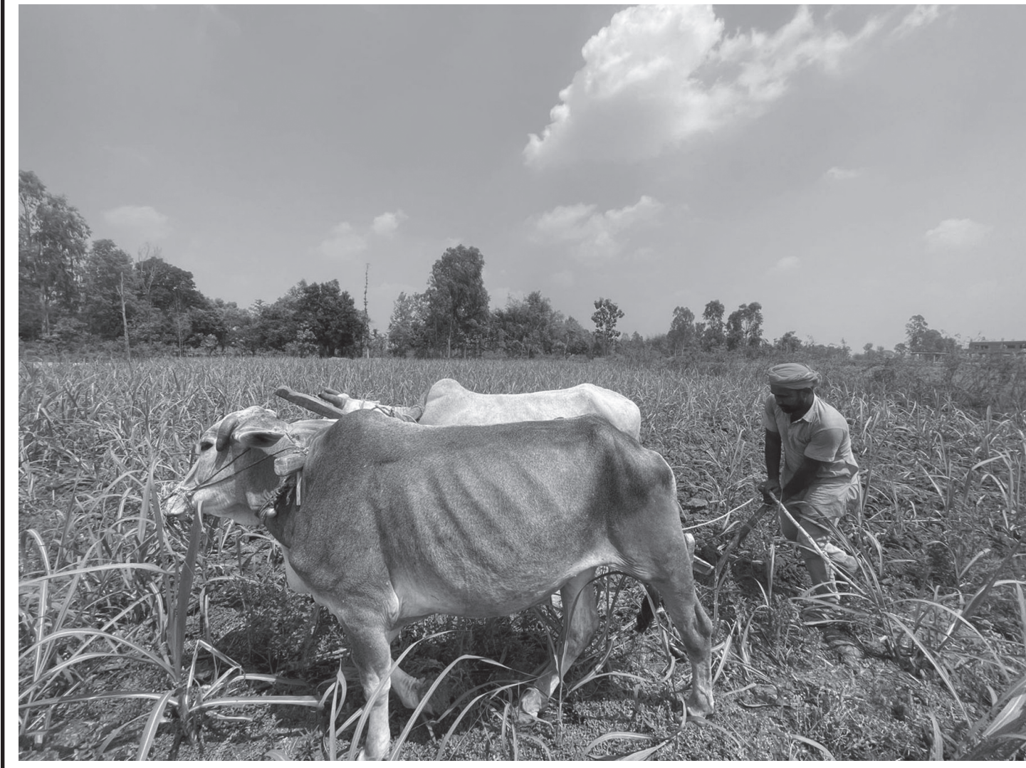
खेत जोत्दै किसान

महोत्तरी जिल्लाको ओरही नगरपालिका-५ श्रीपुर गाउँमा हलोले खेत जोत्दै किसान।