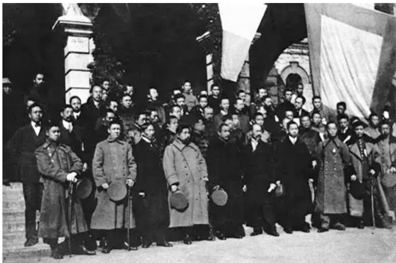
सन् १९१२ जनवरीका दिन नानकिङ अन्तरिम सरकारको व्यवस्थापिका घोषणा समारोहमा सहभागी चिनियाँ नेताहरू (पहिलो पङ्क्तिको बायाँबाट पाँचौँ स्थानमा डा. सन यात सेन)

सन यात सेनको क्रान्तिकारी लीगले देशभर छिड शासनको विरोधको तयारी गर्‍यो। त्यसबेला एक लोकगीत प्रचलित थियो - कसैको आशीर्वाद र ज्योतिषको मुहुर्त चाहिँदैन तीनवर्षे बाल सम्राटको बाबुको शासन टिक्दैन