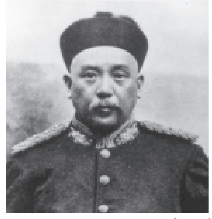
युआन-शि-काई र ह्वाङ सिङ

तर, ती सबै स्थिति बुझेर युआन शिकाईले १९१३ जून महिनामा कोमिन्ताइका सदस्यहरू क्याङसी, क्याङतुङ र आन्हवी प्रान्तका गभर्नरहरूलाई बर्खास्तीको घोषणा गरे। यसकारण, क्याङसीका गभर्नर लि लियु च्युन (Li Lieh Chun) ले युआन शिकाईको विश्वासघातको निन्दा गर्दै उसको सेनालाई दण्ड दिन आफ्नो सेनालाई क्याङसीको हुकोउ (Hukou) कब्जा गर्न आदेश दिए। क्याङसु, आन्हवी, क्याङतुङ, फुकिन र हुनान प्रान्तले तुरुन्तै