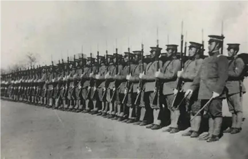
सन १९११ को क्रान्तिकारुद्ध संरा अमेरिकी साम्राज्यवादको साङ्घाइमा सेना उतारेको थियो।

विजयले मानव जातिको जीवनको एक ऐतिहासिक घुम्ती दियो। समाजवादी सरकारले केही समयमै जारकालीन रूसले गरेको चीनसँगका सबै असमान सन्धिहरूलाई खारेज गर्यो र चीनमाथि जारका साम्राज्यवादीहरूले थोपरेका सबै सन्धिको