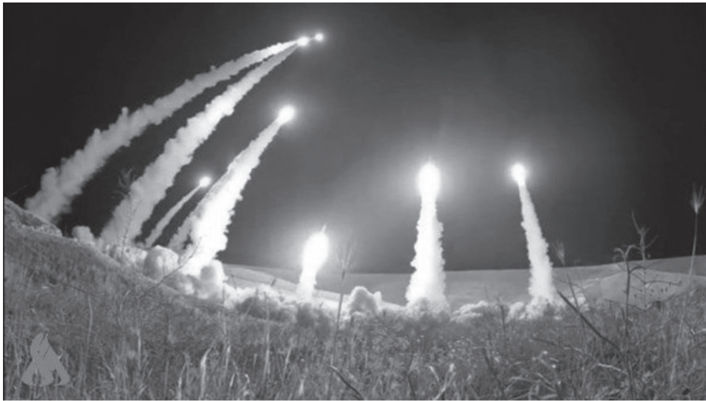
इरानी प्रतिरोध टु प्रमिस-४ को ८३ औं लहरअनुसार मिसाइल प्रहार

तेहरान, २७ मार्च (सिन्हवा) । इरानले बहराइन र संयुक्त अरब इमिरेट्स (यूएई) का होटल मालिकहरूलाई यदि उनीहरूले अमेरिकी सैनिकहरूलाई आफ्नो होटलमा राखे भने त्यसको नकारात्मक परिणाम हुन सक्ने चेतावनी दिएको छ । अर्ध-सरकारी फार्स न्यूज एजेन्सीले बिहीबार यो जानकारी प्रकाशित गरेको छ ।