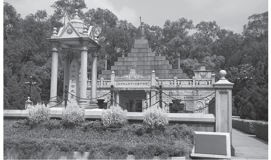
सन १९११ को क्रान्तिका ७२ वीर सहिदहरूको समाधिस्थल

राष्ट्रिय पुँजीवादको द्रुततर विकास तथा सर्वहारावर्गको वृद्धिले चिनियाँ जनतामा बौद्धिक जागरणबाट नयाँ सांस्कृतिक आन्दोलनको