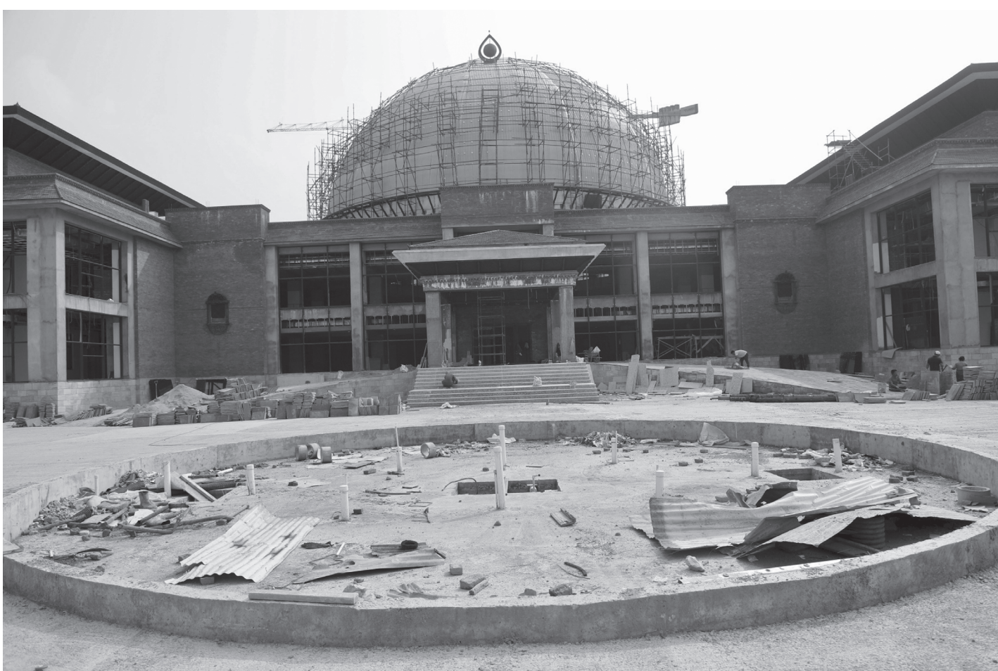
सङ्घीय संसद् भवन तीव्रगतिमा निर्माण हुँदै : सिंहदरबार परिसरभित्र निर्माण हुँदै गरेको सङ्घीय संसद् भवन । सो भवनमा आगामी संसद्को अधिवेशन सञ्चालन गर्ने भएकाले तीव्रगतिमा काम हुँदै छ ।

कानूनविपरीत कृत्रिम अभाव सृजना गर्ने व्यक्ति, फर्म वा संस्थाबारे जानकारी पाएमा सम्बन्धित निकायलाई सूचित गर्न पनि प्रशासनले सबैमा अपिल गरेको सहायक प्रमुख जिल्ला अधिकारी शर्माले जानकारी दिनुभयो । (रासस)