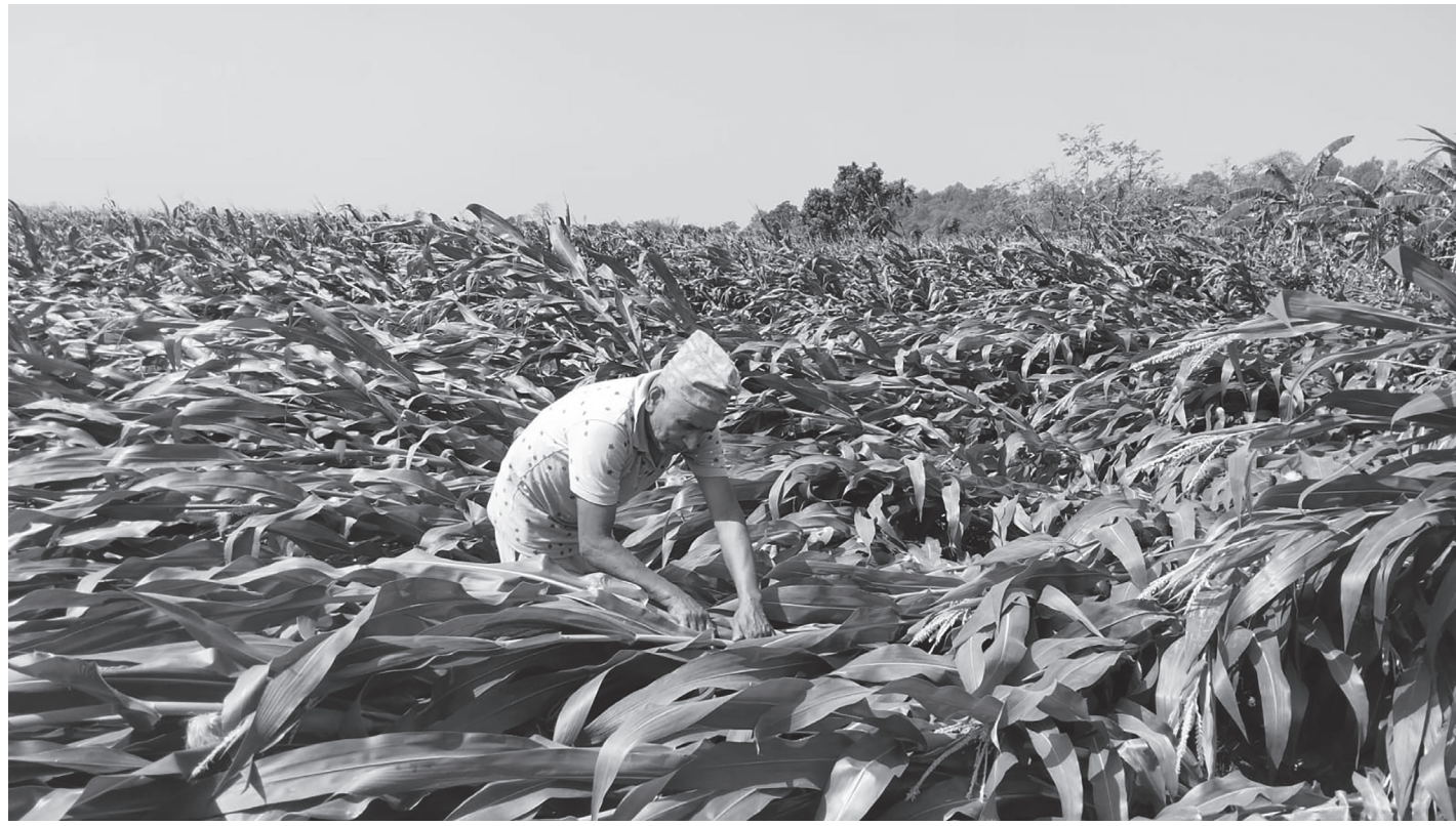
हावाहुरीका कारण मकैवालीमा क्षति

रौतहटको चन्द्रपुर नगरपालिका-२ जुडिबेलामा हिजो साँझ आएको हावाहुरीले मकैवालीमा पुऱ्याएको क्षति ।