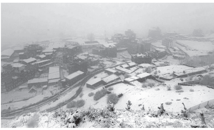
मुस्ताङको वारागुड मुक्तिक्षेत्र गाउँपालिका-१ स्थित मुक्तिनाथ क्षेत्रमा शुक्रबार भएको हिमपात । मुक्तिक्षेत्रमा दिउँसो चार बजेदेखि हिमपात भएको हो ।

मुस्ताङ, ६, चैत । वारागुड मुक्तिक्षेत्रमा छैटौँ पटक भारी हिमपात भएको छ । आज अपराह्न ४:०० बजेदेखि मुक्तिनाथ क्षेत्रमा भारी हिमपात भएको हो । मुस्ताङमा कार्तिक १० गतेयता हालसम्म छैटौँपटक हिमपात भएको छ । हिमपातसँगै मुक्तिनाथ मन्दिर क्षेत्र आसपासका डाँडाकाँडा हिउँले सेताम्ले भइसकेको छ । मुक्तिनाथ क्षेत्रको मुक्तिनाथ, रानीपौवा, भारकोट, खिङ्गा, छेङ्गुर, पुडाक र भोडलगायतका स्थानमा बाक्लो हिमपात भइरहेको छ । त्यसैगरी, माथिल्लो मुस्ताङको