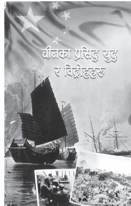
अफिम युद्धको परिणाम

बेलायतले यसरी चीनको सार्वभौमिकता तथा क्षेत्रीय अखण्डतामाथि भाँजो हाल्दै गयो।