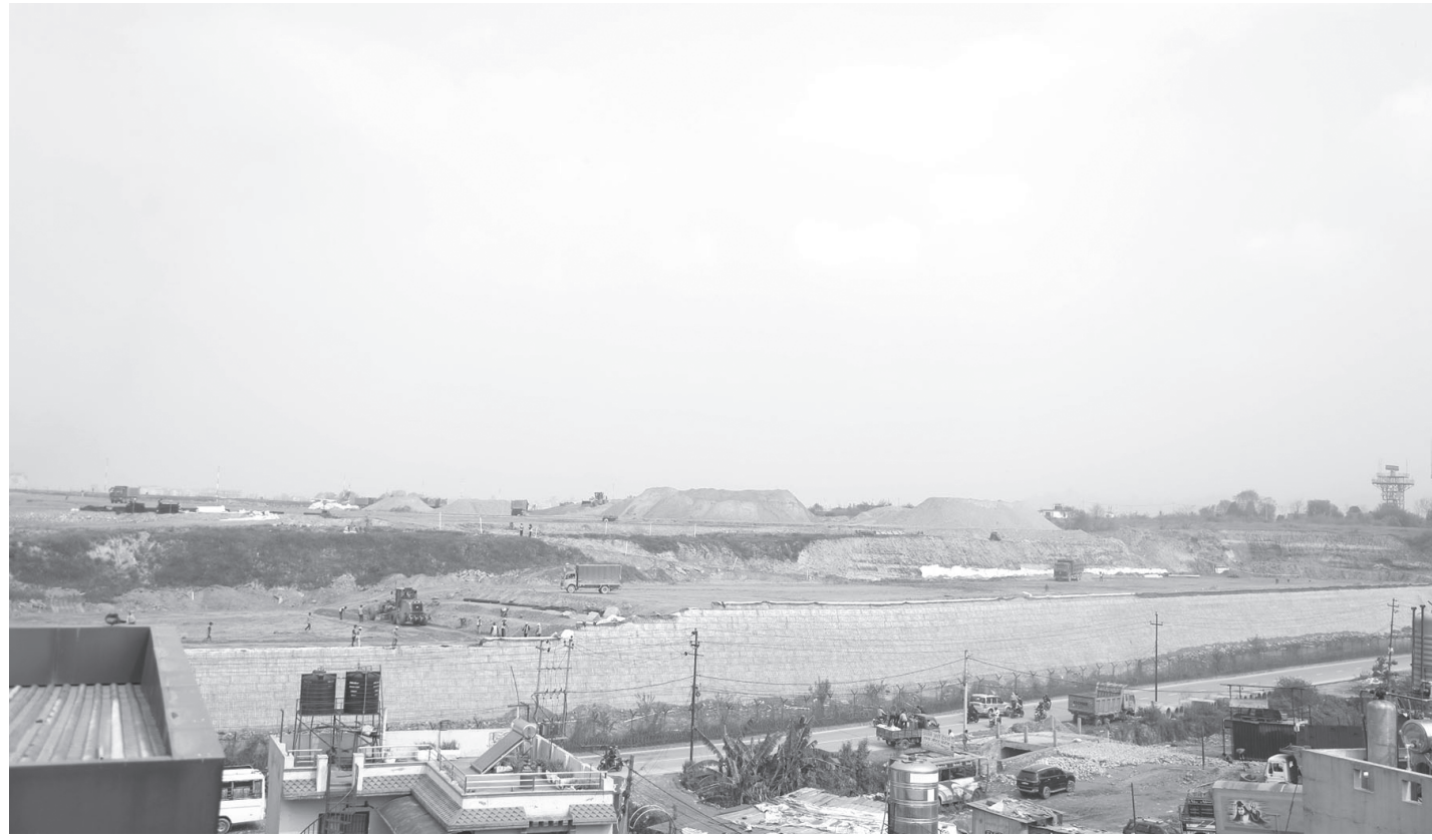
त्रिभुवन अन्तर्राष्ट्रिय विमानस्थल विस्तार

काठमाडौंको गोठारबाट देखिएको त्रिभुवन अन्तर्राष्ट्रिय विमानस्थल विस्तारको क्रममा निर्माणाधीन संरचना।