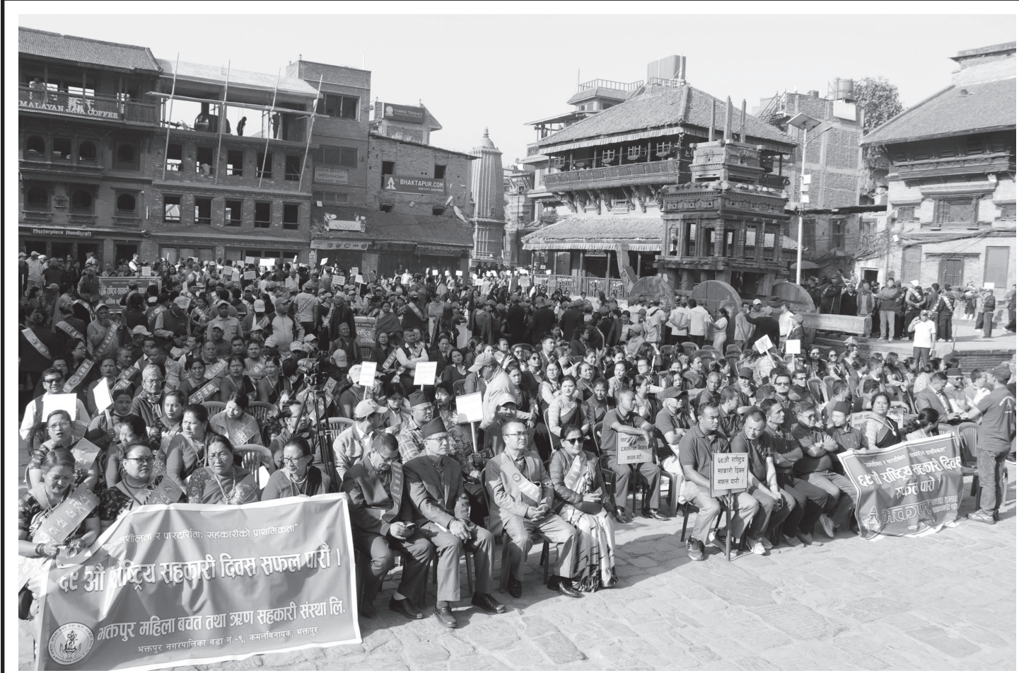
६९ औं राष्ट्रिय सहकारी दिवसको अवसरमा शुक्रबार भक्तपुर नगरमा आयोजित यालीपछिको सभामा सहभागीहरू ।