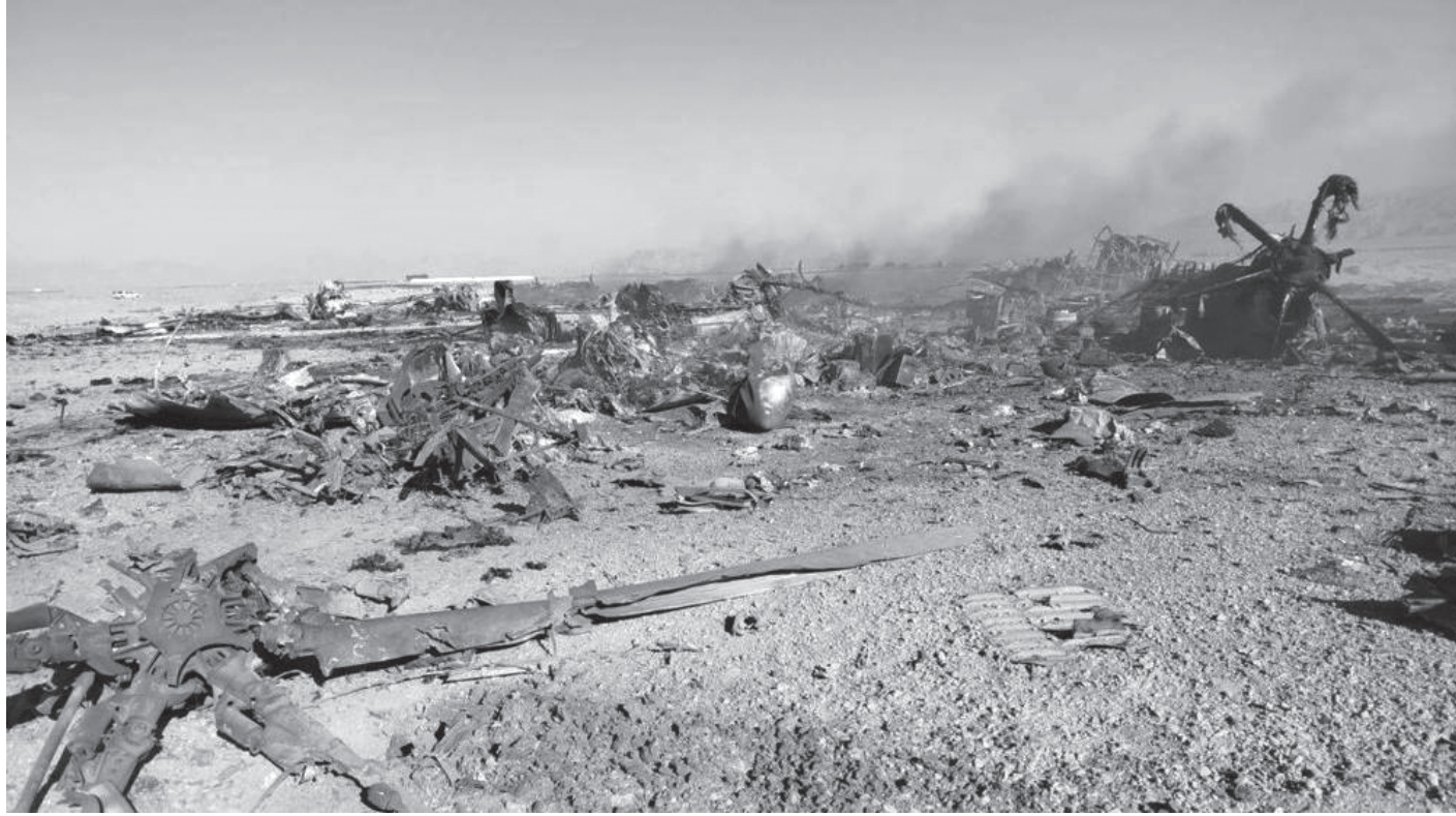
इरानी क्षेप्यास्त्रले ध्वस्त बनाइएका अमेरिकी युद्धक विमानका भग्नावशेष

वाशिङ्टन, २२ चैत (एपी) । इरानले अमेरिकी दुई युद्धविमान खसाल्नु पछिल्लो २० वर्षयताकै दुर्लभ घटना भएको जनाइएको छ । यस घटनाले इरानको प्रतिहार क्षमता अझै कायम रहेको देखाएको विश्लेषण गरिएको छ ।