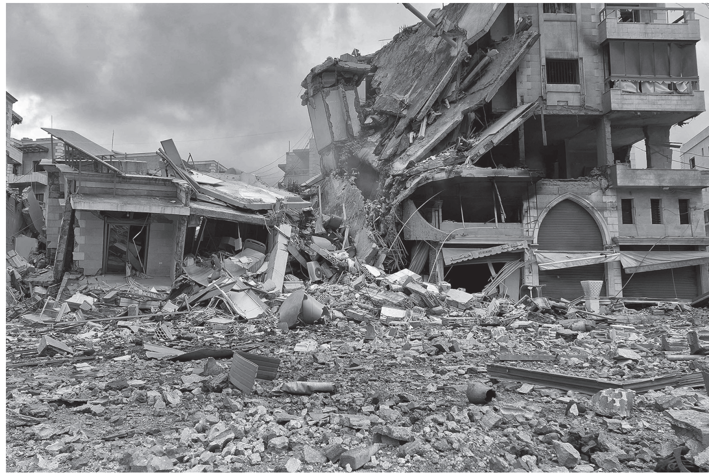
दक्षिण लेबनानको नावातेह नगरमा इजरायलको रातभरिको बमबारीपछि ध्वस्त भएका आवासीय भवनहरू अप्रिल ६, २०२२ का दिन। इजरायल-अमेरिकाले इजरायलमा आक्रमण थालेसँगै इजरायलले लबनानमाथि कब्जा गर्ने उद्देश्यले बमबारी र स्थल आक्रमण थालेको थियो।