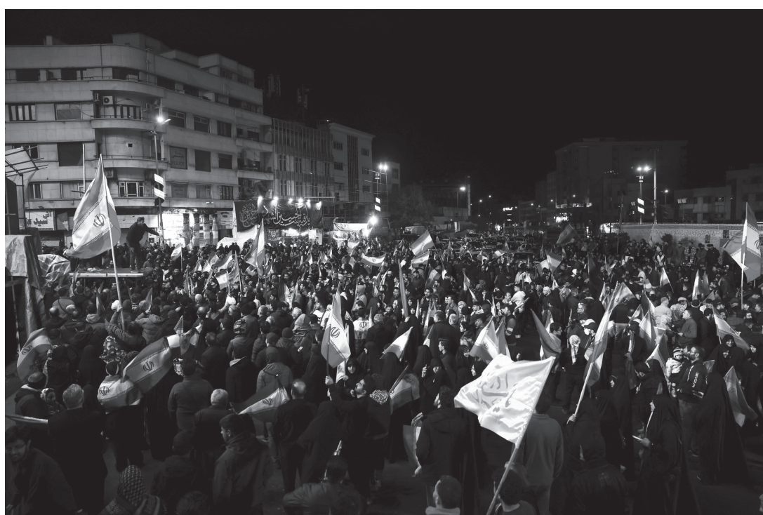
इरानका सर्त मानेर संरा अमेरिकी राष्ट्रपति डोनाल्ड ट्रम्पले १५ दिने युद्धविराम घोषणा गरेपछि युद्धमा विजय भएको भन्दै इरानको सडकमा खुसीयाली मनाइरहेका इरानी जनता ८ अप्रिल २०२६ को बिहान ।

इरानको शीर्ष सुरक्षा निकायले तेहरानले आफ्नो योजना पाकिस्तानमार्फत अमेरिकालाई बुझाएको र वाशिङ्गटनले त्यसका सिद्धान्तहरूलाई वार्ताको आधारको रूपमा स्वीकार गरेको जनाएको