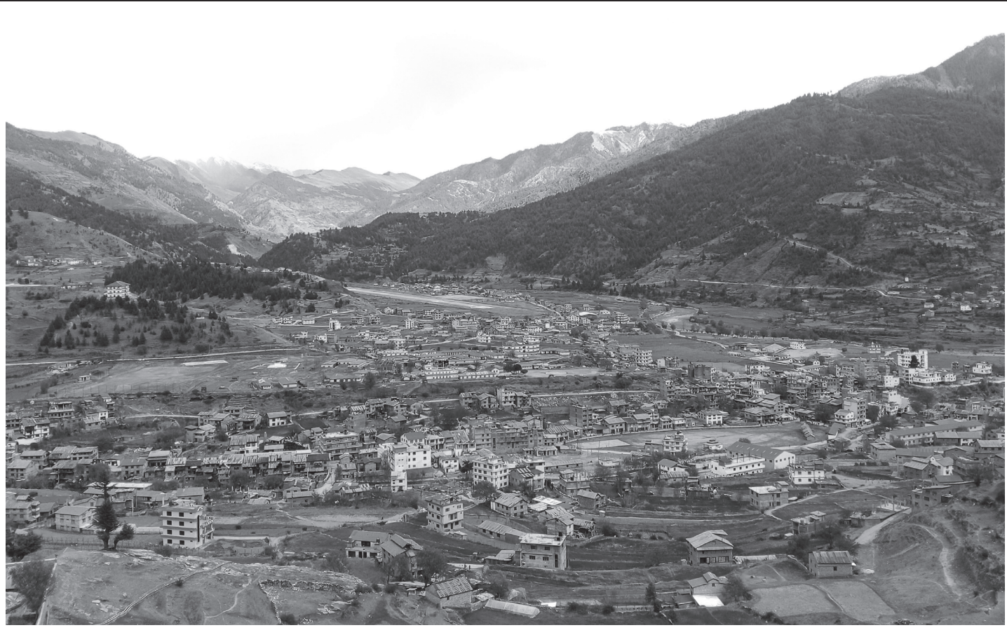
जुम्लाको खलङ्गा बजार

जुम्लाको सदरमुकाम खलङ्गा बजार र आसपासको क्षेत्र। पछिल्लो समय यहाँ सहरीकरण बढ्दो छ।