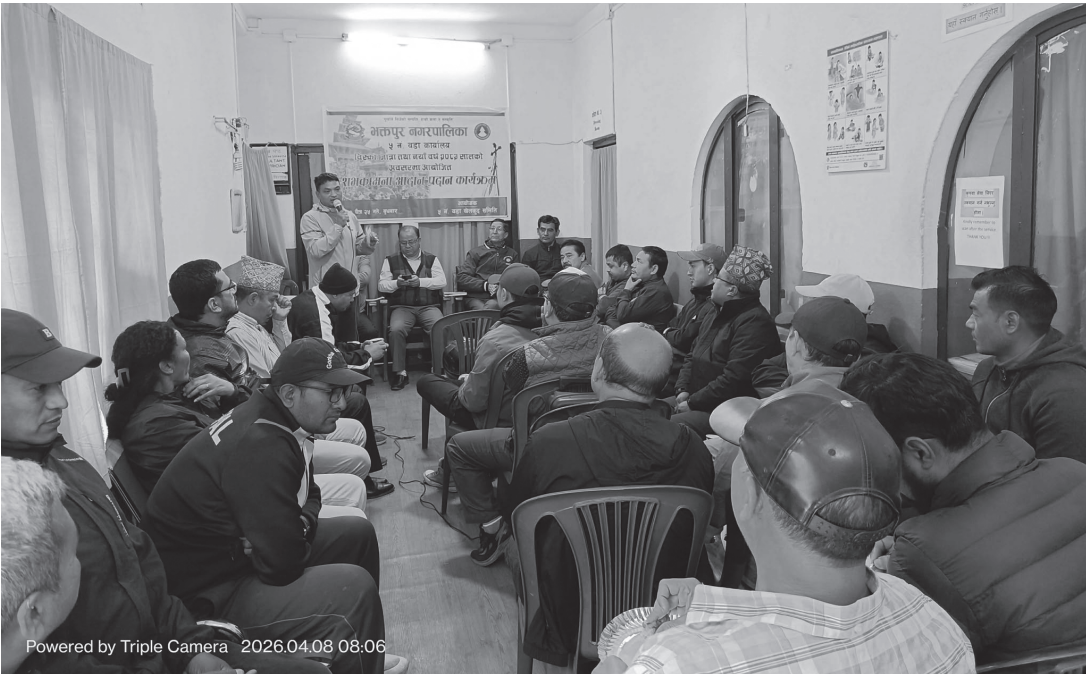
Powered by Triple Camera 2026.04.08 08:06

भक्तपुर, २५ चैत । वडा नं ५ खेलकुद समितिको आयोजनामा वडामा बुधबार आसन्न बिस्का जात्रा पर्व र नव वर्ष २०८३ को शुभ-अवसरमा वडावासीहरूबिच शुभकामना आदानप्रदान कार्यक्रम भयो।