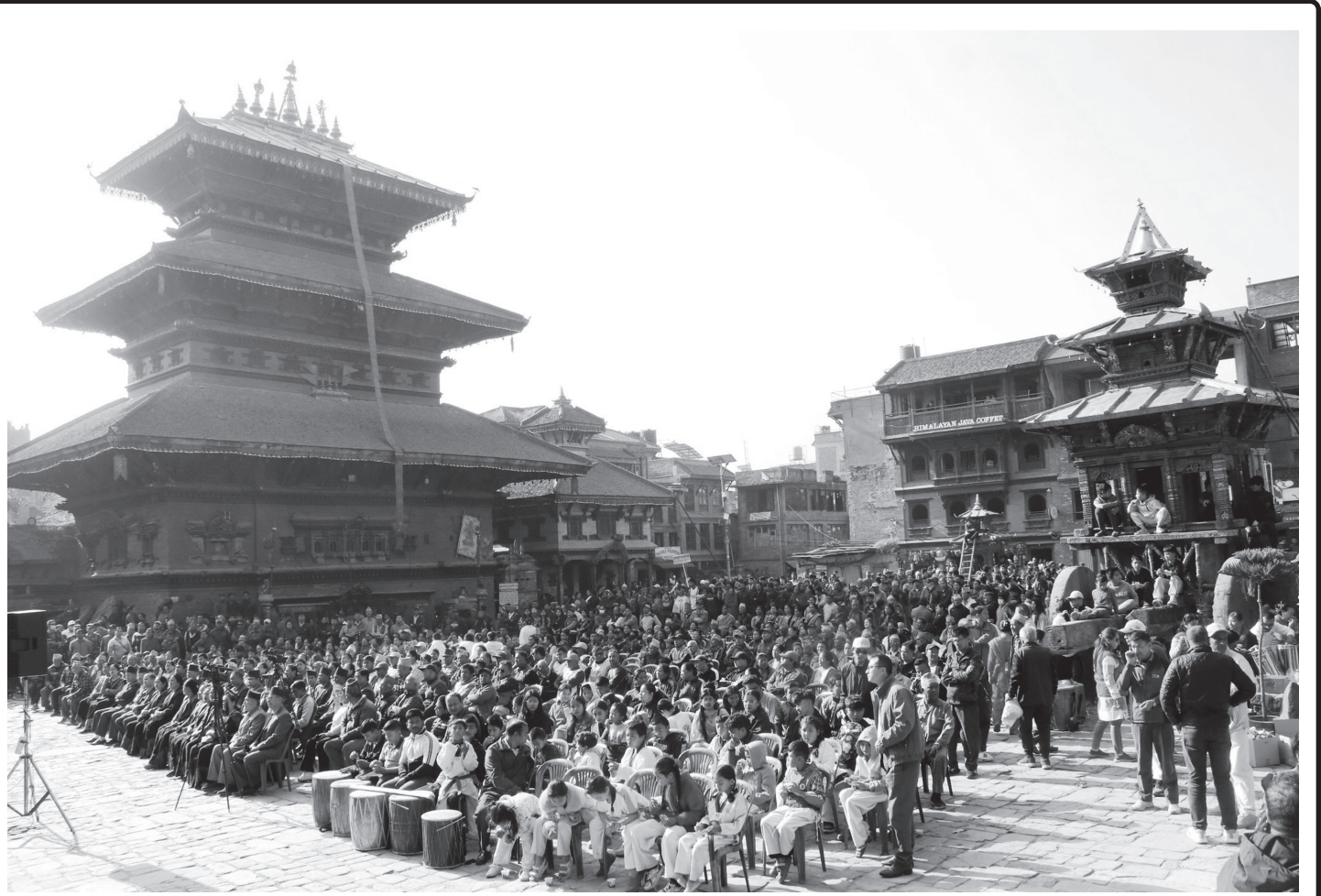
प्रसिद्ध बिस्का जात्रा तथा नयाँ वर्ष २०८२ को अवसरमा भक्तपुर नगरपालिकाको आह्वानमा २०८२ चैत्र २७ गते शुक्रबार आयोजित शुभकामना ज्ञाली तथा सभामा सहभागीहरू ।

सभाले प्रतिवेदनलाई सुझावसहित पारित गर्‍यो ।