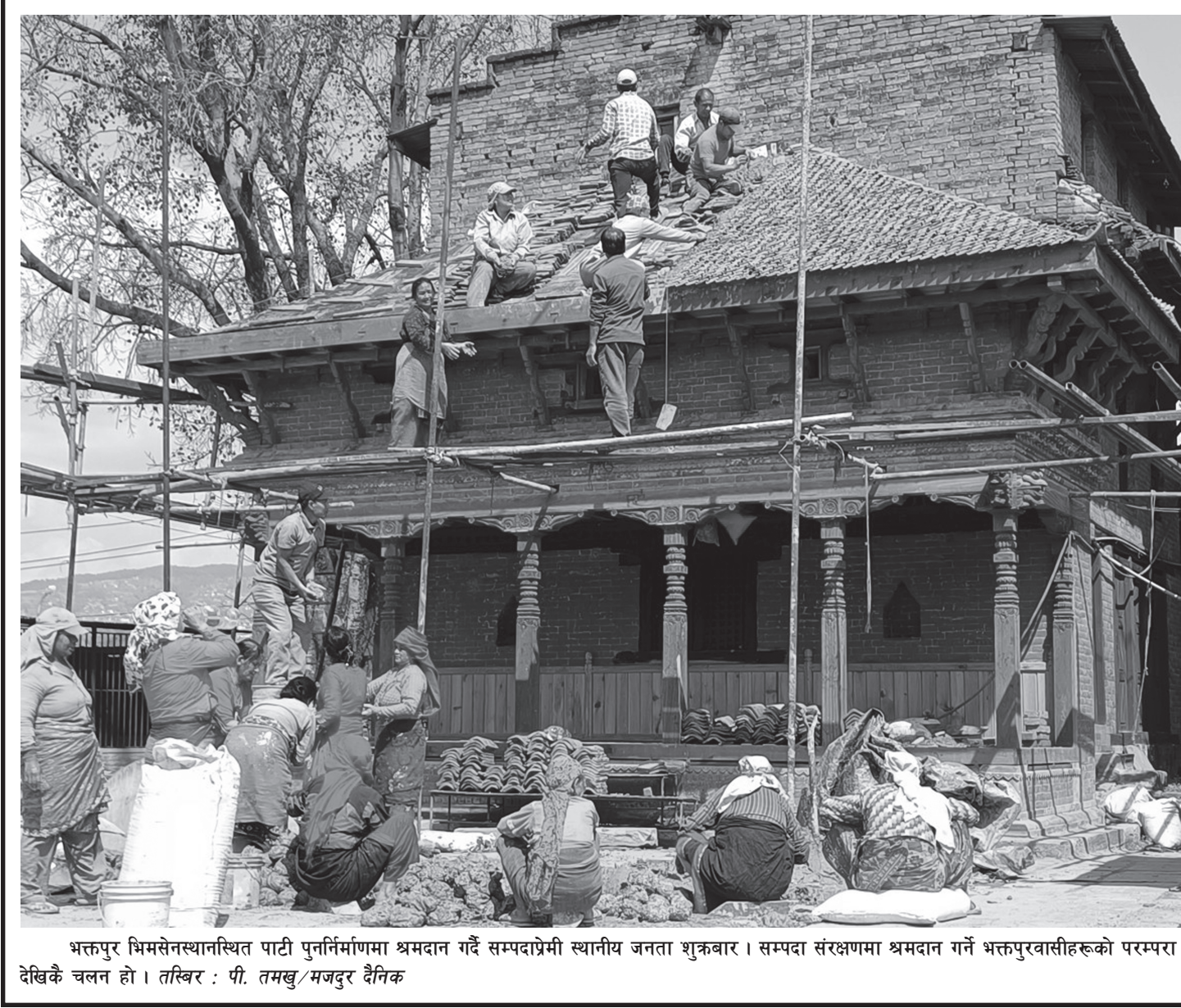
भक्तपुर भिमसेनस्थानस्थित पाटी पुनर्निर्माणमा श्रमदान गर्दै सम्पदाप्रेमी स्थानीय जनता शुक्रबार । सम्पदा संरक्षणमा श्रमदान गर्ने भक्तपुरवासीहरूको परम्परा देखिकै चलन हो ।