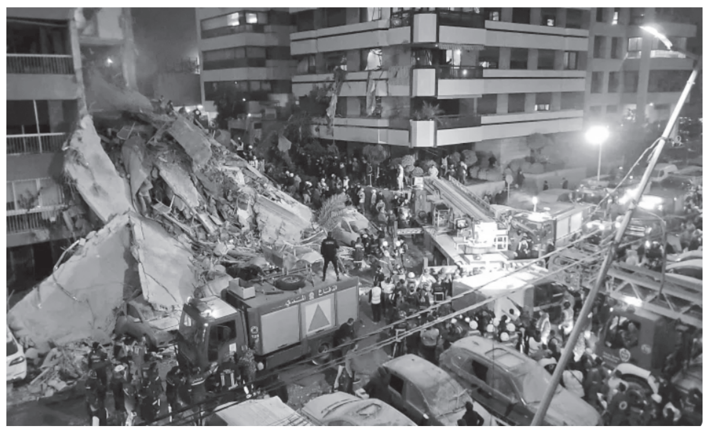
युद्धविरामको उल्लङ्घन गर्दै इजरायली सेनाले लेबनानको राजधानी बेरुतको तालेट अल खायात नगरमा गरेको हवाई मिसाइल हमलापछि पीडितहरूको उद्धार गर्न जुटेका उद्धारकर्मीहरू अप्रिल १०, २०२६ का दिन।