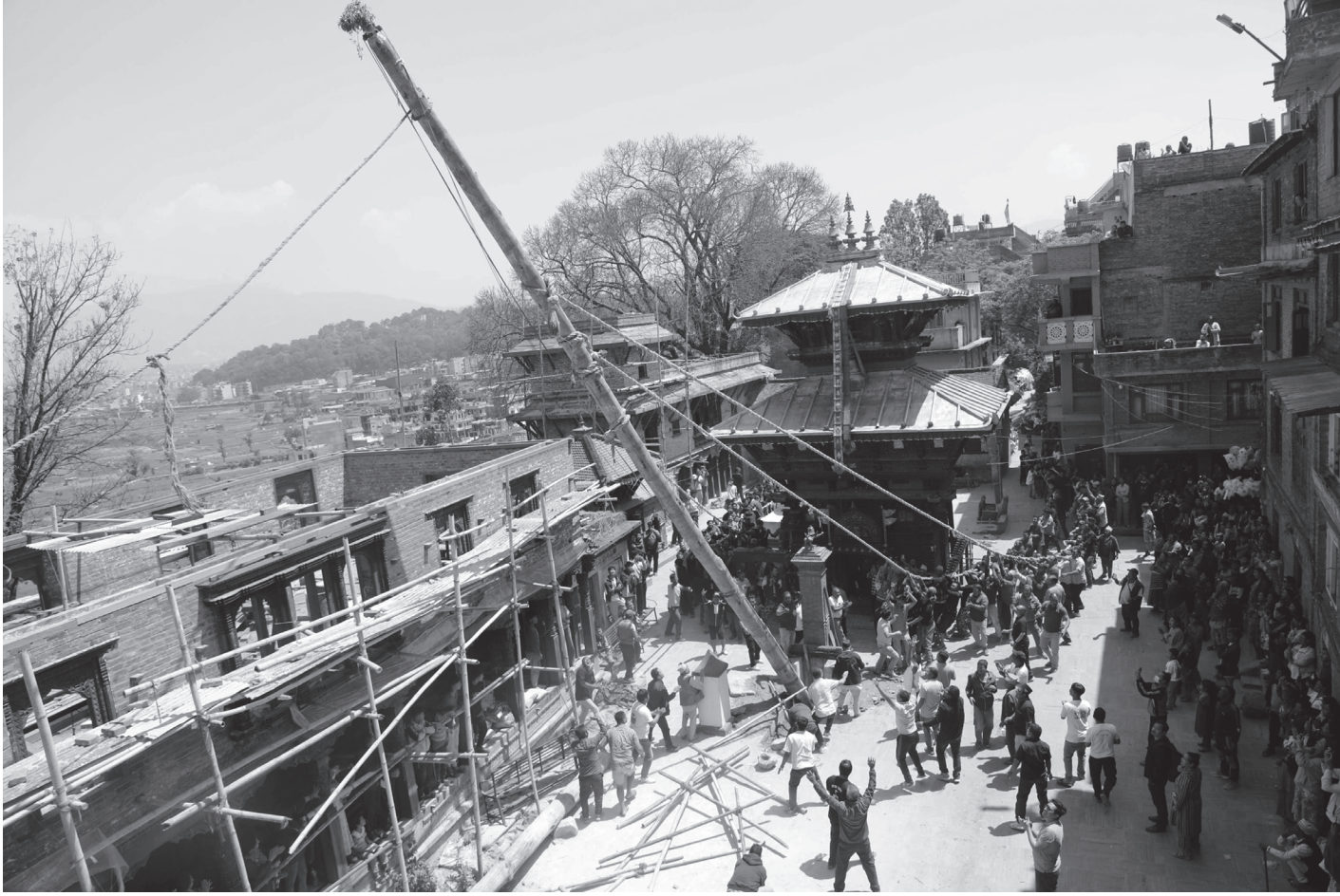
बिस्का जात्रामा लिङ्गो ठड्याइँदै

भक्तपुरको मध्यपुर थिमि नगरपालिका-८, बोदेस्थित महालक्ष्मी मन्दिर अगाडि बिस्का: जात्राको सुरुको दिन सोमबार ३२ हातको लिङ्गो ठड्याउने गुठीयार तथा स्थानीय ।