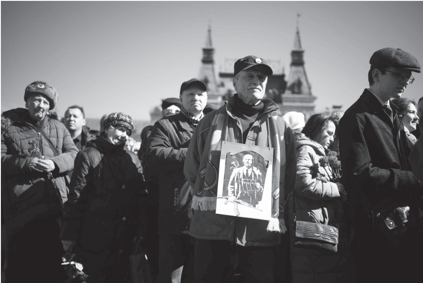
रुसी समाजवादी क्रान्तिकार नेता एवं समाजवादी सोभियत सङ्घका संस्थापक भ्लादिमिर इल्यिच लेनिनको १५६ औं जन्म जयन्तीको दिन रुसी महासङ्घको राजधानी मस्कोस्थित लेनिनको समाधिस्थलमा पुष्पार्पणको निमित्त लामबद्ध रुसी जनता अप्रिल २२, २०२६ का दिन ।

★ वर्ष : २८ ★ अङ्क : ९० ★ ने. सं. ११४६ वखला थुव, सप्तमी ★ बिहीबार ★ १० वैशाख, २०८३ ★ April 23, 2026, Thursday ★ मूल्य रु. ५१- ★ पृष्ठ ८