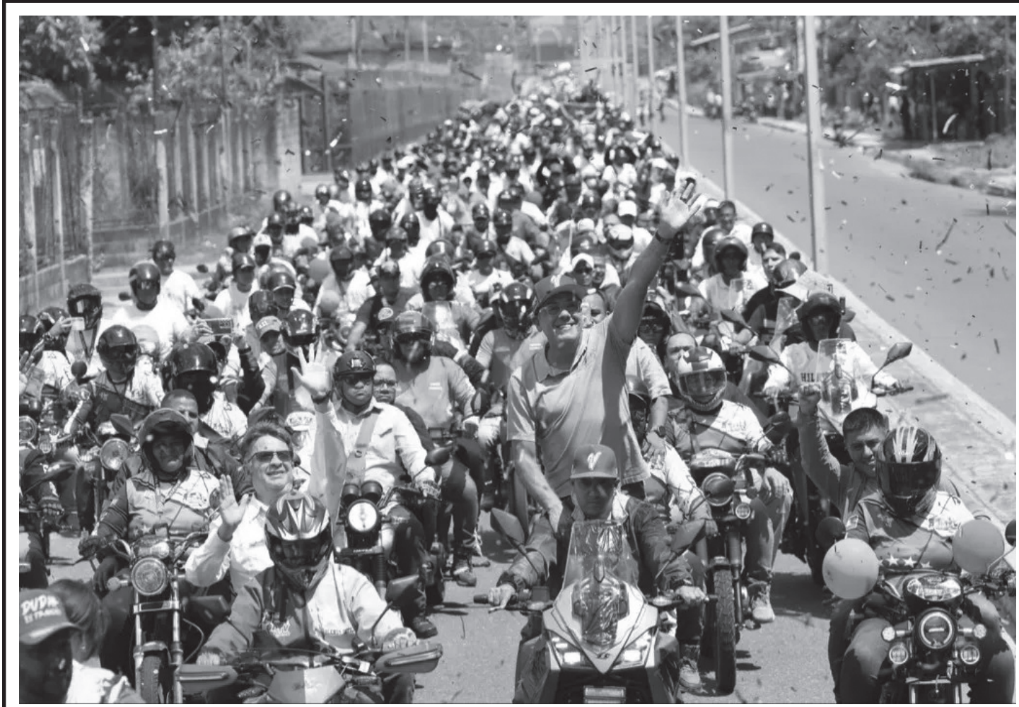
भेनेजुयालाको मेरिडा राज्यमा अमेरिकी प्रतिबन्ध र नाकाबन्दी हटाउन माग गर्दै राष्ट्रिय सम्प्रभुता रक्षार्थ मोटरसाइकल चाली गर्दै भेनेजुयाली युवाहरू अप्रिल २५, २०२६ का दिन।