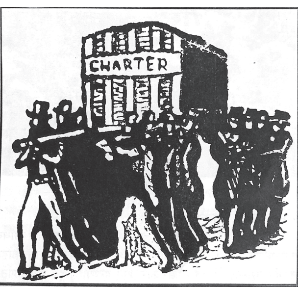
५० लाख जनताको हस्ताक्षर भएको मागपत्र बोकिरहेका मजदुरहरू

या बिन्तीपत्रको मागलाई संसदले स्वीकार गर्ने हो वा राज्यशक्ति कब्जा गर्न कामदारवर्गले विद्रोह सुरु गर्नुपर्ने हो भनेर त्यसमा प्रश्न गरिएको थियो। त्यस प्रदर्शनमा ५ लाख मानिसले भाग लिएका थिए।