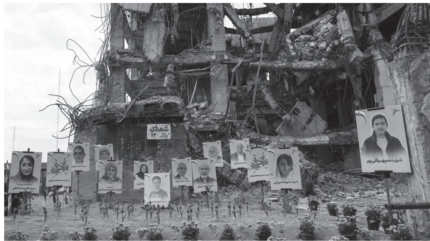
इरानको राजधानी तेहरानमा अमेरिकी-इजरायली हमलाबाट ध्वस्त भएको आवासीय भवनको भग्नावशेषमा आक्रमणको क्रममा मारिएका त्यस भवनका बासिन्दाहरूको तस्वीर र फूल राखी श्रद्धाञ्जली अर्पण गरिँदै अप्रिल १३, २०२६ का दिन ।