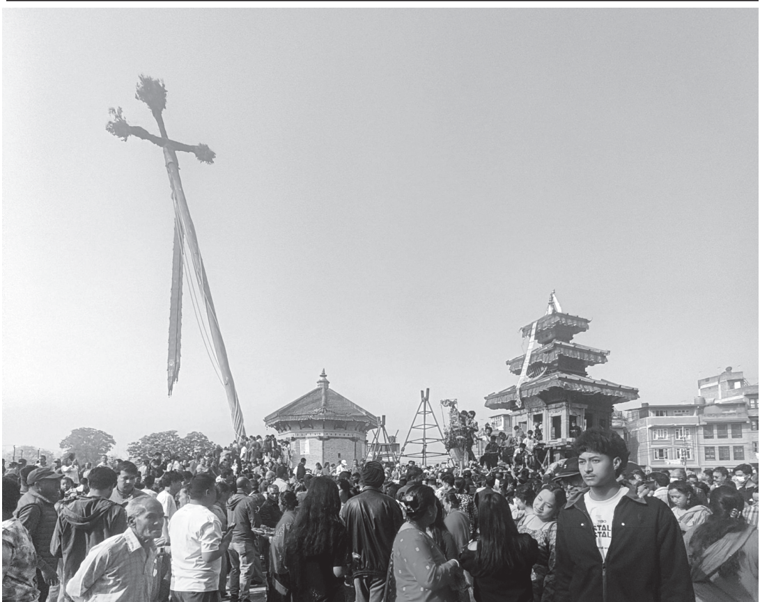
नयाँ वर्ष वैशाख १, २०८३ को बिहान भक्तपुरको भेलुखेलमा अघिल्लो साँझ ठड्याइएको योसिँधो र भैरवनाथको रथसँगै जात्रालुहरू ।

यसकारण, हतारिएर नयाँ काम गर्दाको कस्त आउनेछ भन्नेबारे छलफलपश्चात् मात्रै काम थालेमा विवाद कम होला भन्ने हाम्रो ठम्याइ हो ।