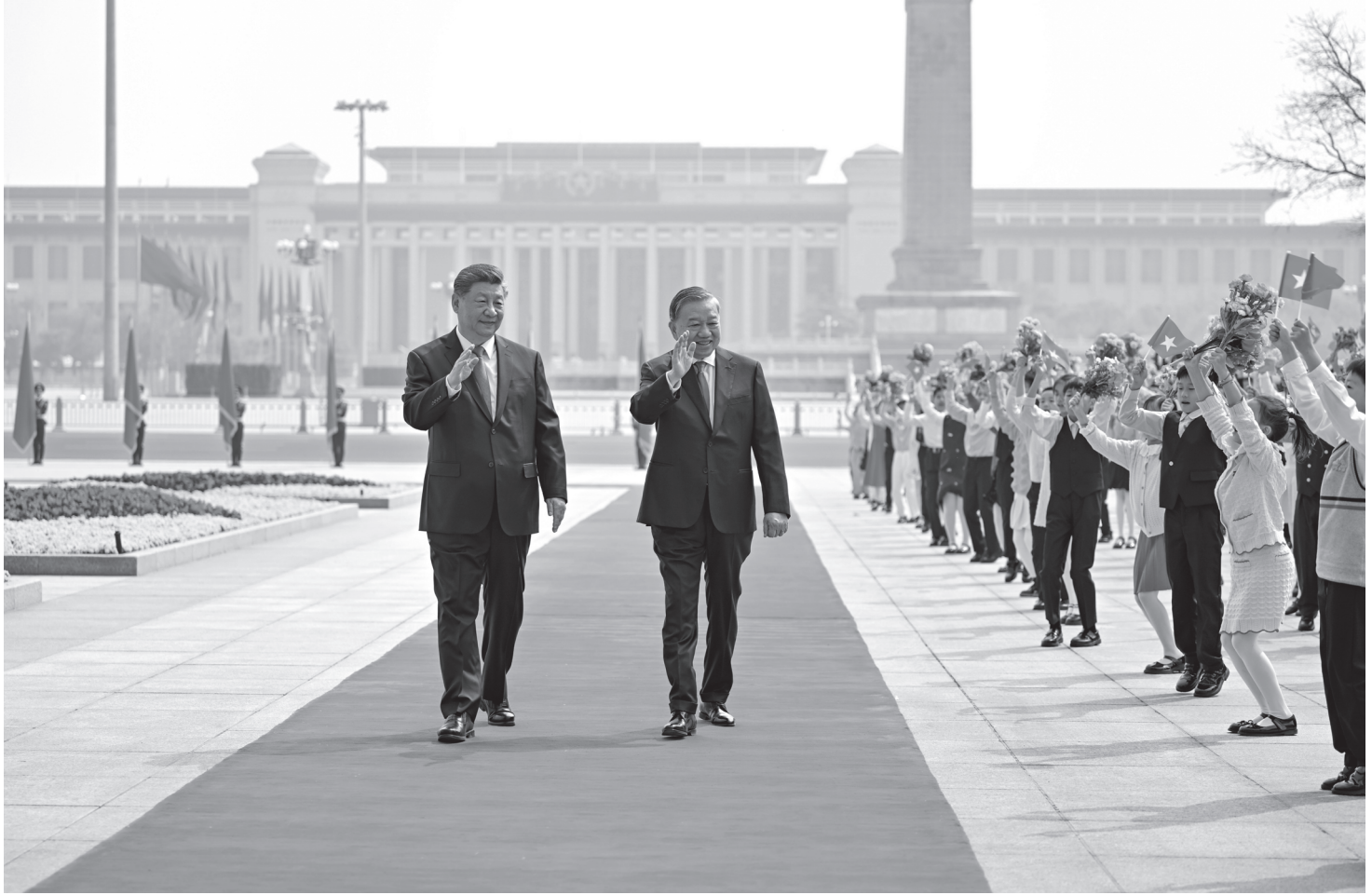
चीनको राजधानी पेइचिङस्थित ग्रेट हल अफ पिपुल्सको प्राङ्गणमा चीनको राजकीय भ्रमणमा आउनुभएका जनगणतन्त्र भियतनामका राष्ट्रपति एवं भियतनाम कम्युनिस्ट पार्टीका महासचिव तो लामलाई भव्य स्वागत गर्दै चिनियाँ राष्ट्रपति सी चिनफिङ र चिनियाँ बालस्वयम्सेवकहरू अप्रिल १५, २०२६ का दिन ।