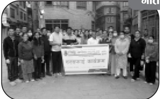
सिद्धि गणेश साकोस परिसर, चोर्चा टोल र पल्लिखेल क्षेत्र सरसफाई कार्यक्रममा संस्थाको समिति एवं कर्मचारीहरूको सहभागिता । (वैशाख ३)