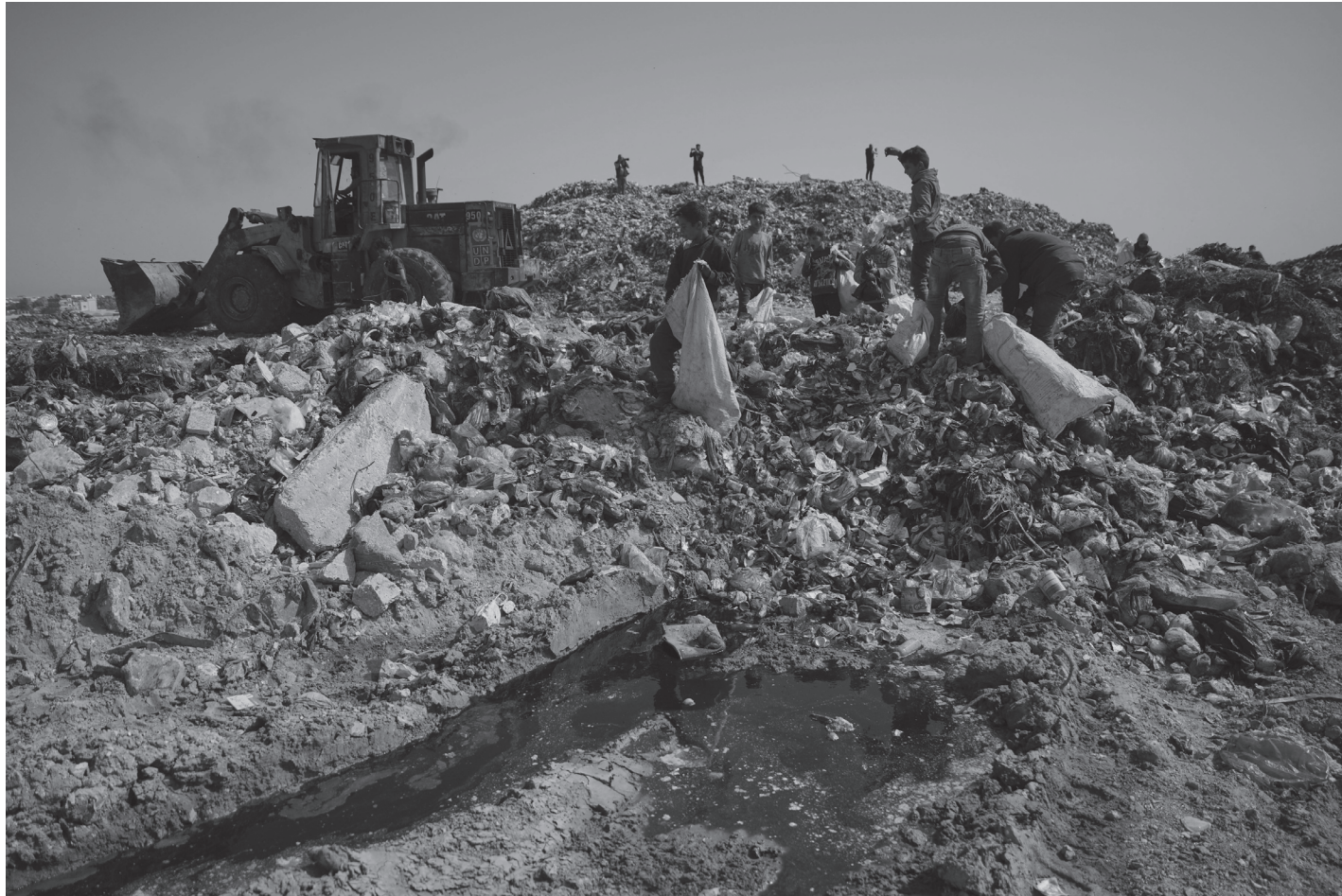
गाजापट्टीको डेर अल बलाह सहरबाहिर रहेको ल्यान्डफिल साइटमा केही उपयोगी वस्तुको खोजी गर्दै घरवारविहीन टुहुरा बालबालिकाहरू अप्रिल १६, २०२६ का दिन । इजरायलले गाजापट्टीको नाकाबन्दी कडा पारिँदा उपभोग्य वस्तुको अभाव चुलिएको छ ।