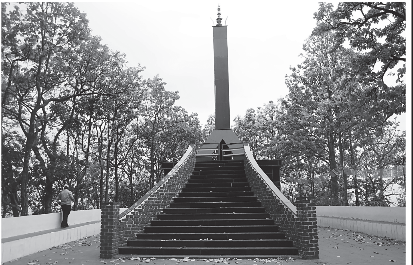
बलभद्र खलङ्गा युद्ध स्मारक

विभागले जारी गरेको विज्ञप्तिमा भनिएको छ, "बुधवार एकैदिन ५६ वटा व्यावसायिक फर्ममा अनुगमन गरी सुधारात्मक निर्देशन दिइएको छ । दैनिक उपभोग्य वस्तु तथा अन्य सामग्री बिक्री-वितरण गर्ने व्यावसायिक फर्म, पसलले बिल बीजक दिए/नदिएको, उपभोक्ताले देखेन गरी मूल्यसूची राखेन/राखेको, कानुनअनुसार तिर्नुपर्ने कर तथा अन्य क्रियाकलाप गरे/नगरेको विषयमा जानकारी लिएको छ ।" उपभोक्ता अधिकारकर्मी तथा सरोकार भएकाहरूको उपस्थितिमा अनुगमन गरिएको विभागले जनाएको छ । (रासस)