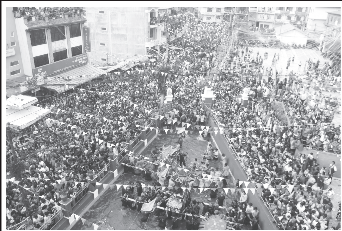
बिस्का जात्रा - टोखा

काठमाडौंको टोखामा बिहीबार बिस्का जात्रा मनाउँदै स्थानीय बासिन्दा ।