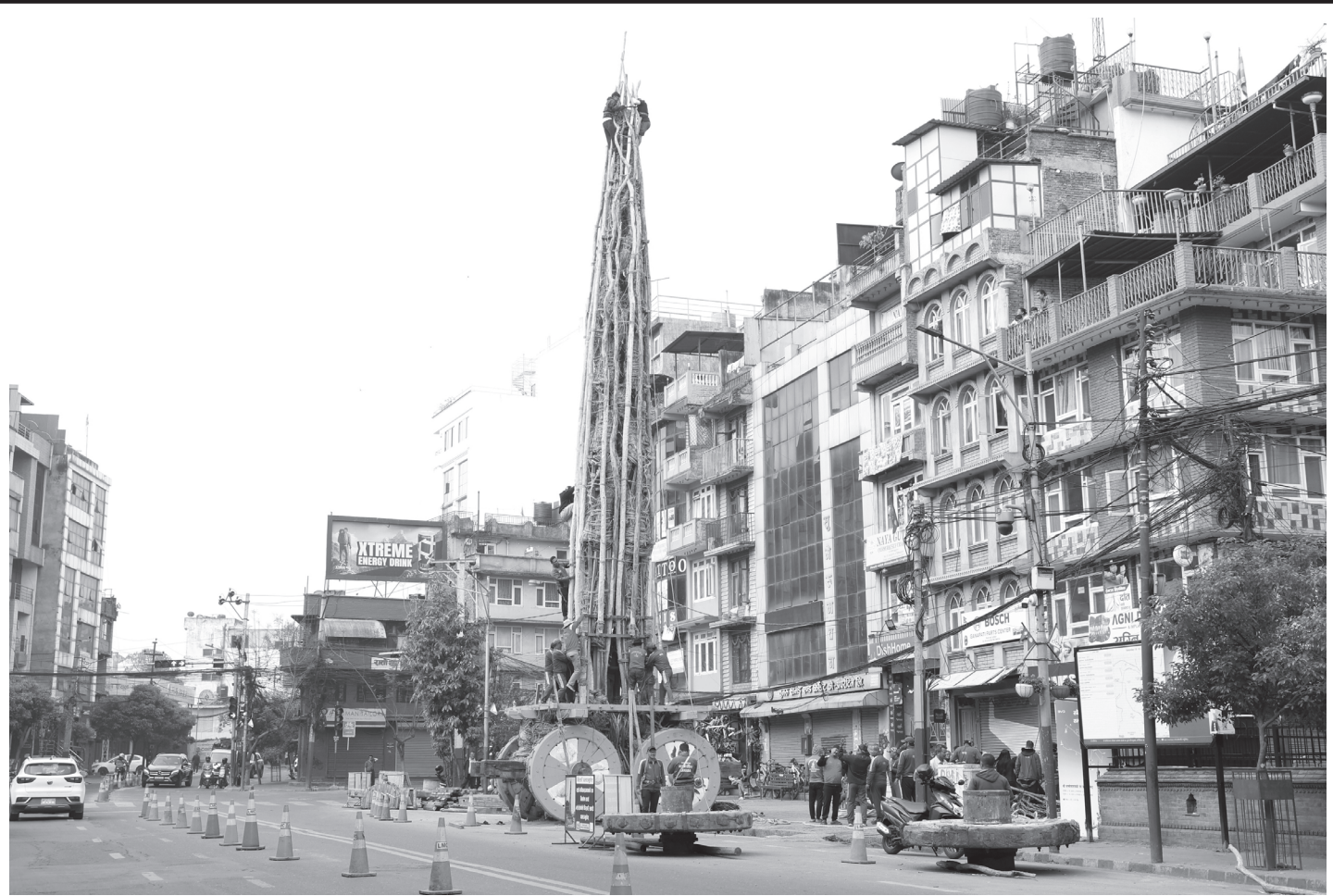
रातो मच्छिन्द्रनाथ रथ निर्माण गरिँदै

ललितपुरको पुल्चोकमा ऐतिहासिक रातो मच्छिन्द्रनाथ जात्राका लागि रथ निर्माण गरिँदै।