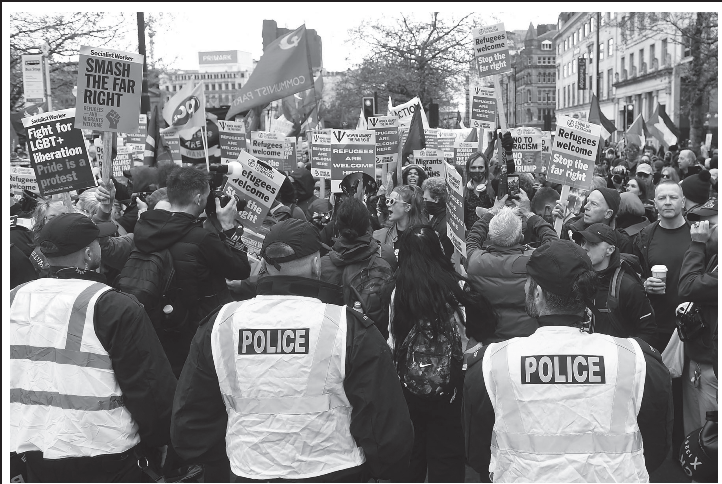
संयुक्त अधिराज्य (बेलायत) को म्यान्चेस्टर सहरमा आप्रवासनविरोधी दक्षिणपन्थीहरूको प्रदर्शनविरुद्ध प्रगतिशील जनताको प्रदर्शन अप्रिल १८, २०२६ का दिन । प्लेकार्डहरूमा अति दक्षिणपन्थीहरूमाथि रोक लगाउन माग गरिएको छ ।

★ वर्ष : २८ ★ अङ्क : ८६ ★ ने. सं. ११४६ वज्रला श्व, द्वितीया ★ आइतबार ★ ६ वैशाख, २०८३ ★ April 19, 2026, Sunday ★ मूल्य रु. ५०- ★ पृष्ठ ८