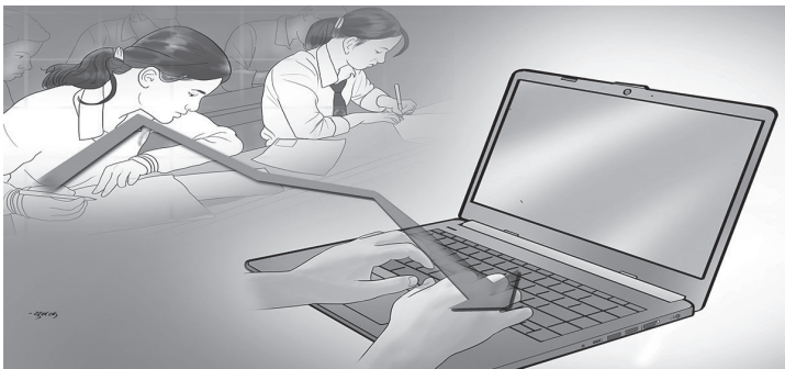
यसका साथै विज्ञहरूले अर्को मानसिक र मस्तिष्क विकासको चिन्ता पनि व्यक्त गर्न थाले। स्कूलमा कम्प्युटर पढेपछि घरमा पनि किताब पढ्ने र हातले लेख्ने अभ्यास

उनीहरूले अध्ययन गरेपछि पत्ता लगाए कि ‘कागजी पुस्तकबाट पढ्दा विद्यार्थीहरूले राम्रोसँग बुझ्न सक्दा रहेछन्। सिकाइ राम्रो हुने रहेछ। साथै किताबबाट सिकाइ ध्यान दिएर पढ्नुपर्ने हुनाले बुझ्नेको