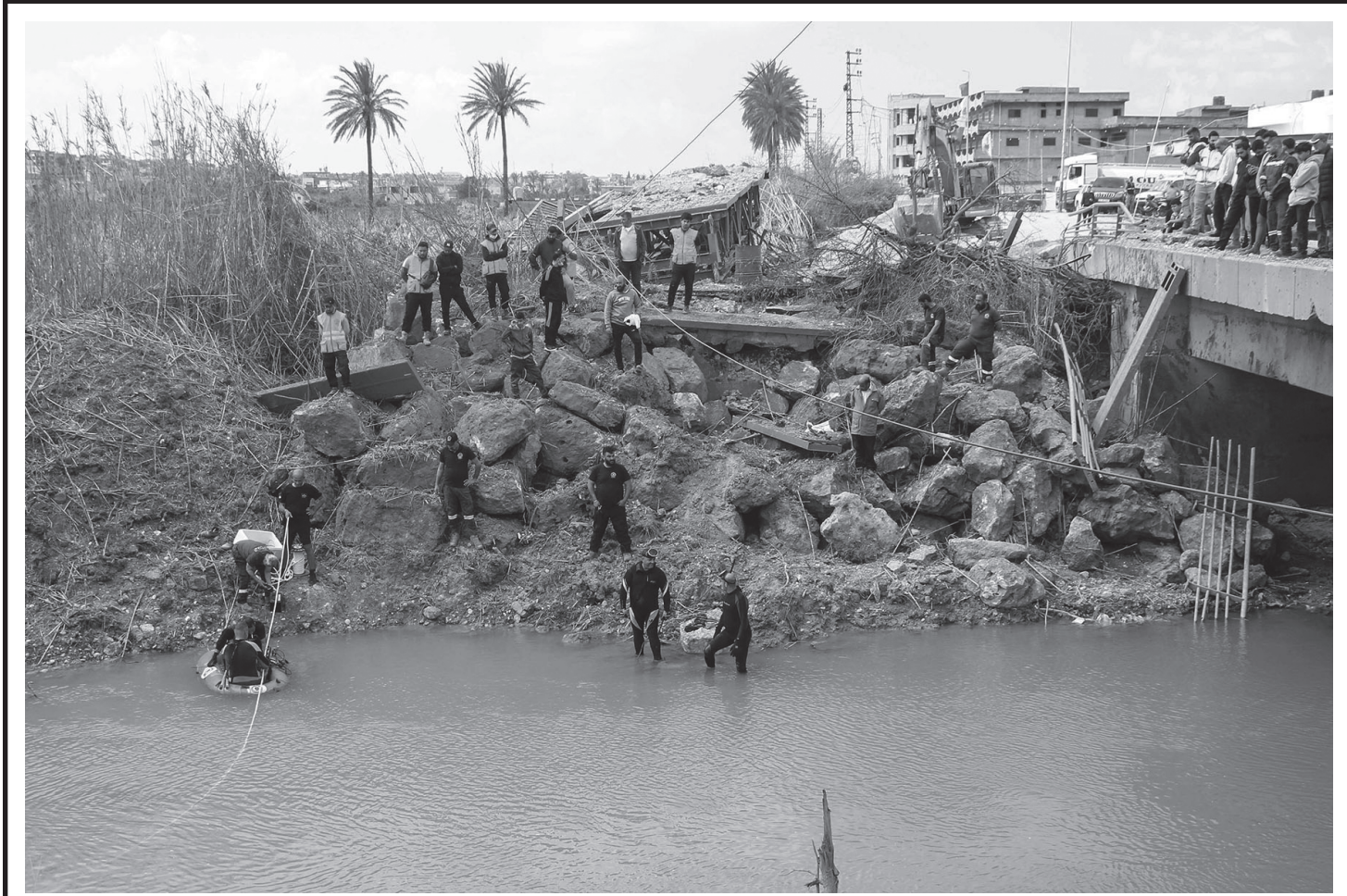
दक्षिणी लेबनानको टायर सहरको कास्मियेह पुलमुनिको नदीमा इजरायली मिसाइल हमलामा परी भगनावशेषमुनि हराइरहेका मानिसहरूको खोजी गर्दै लेबनानी उद्धारकर्मीहरू अप्रिल २०, २०२६ का दिन। हमासलाई खतम गर्ने बहानामा इजरायली सेनाले निर्दोष लेबनानी जनतालाई लक्ष्य बनाइरहेका छन् र लेबनानी भूमि कब्जा गर्ने दुष्प्रयास गरिरहेको छ।