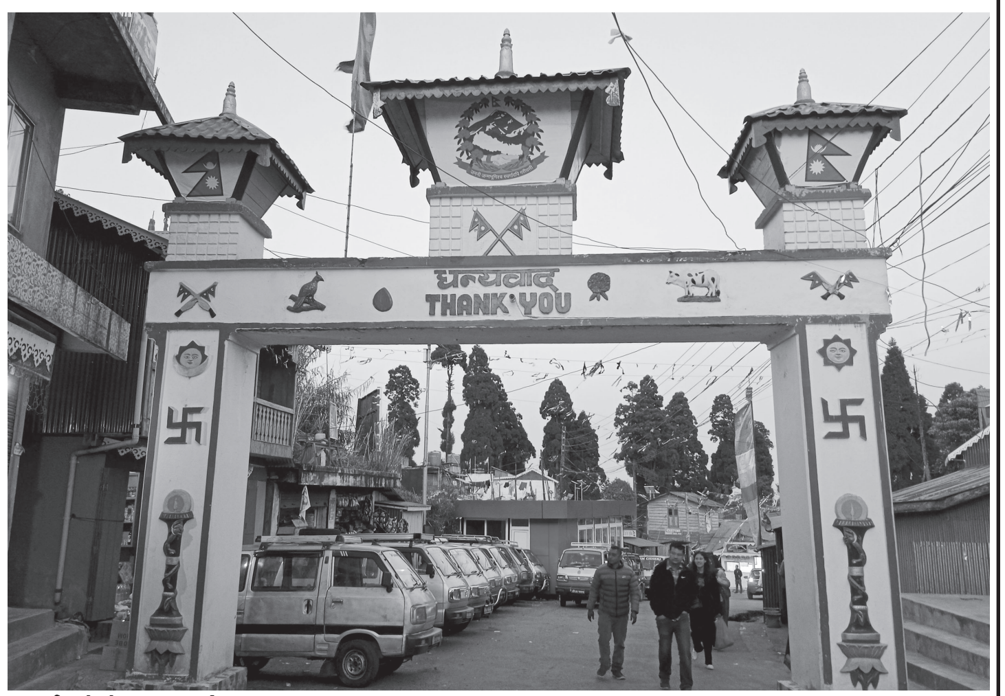
बन्द गरिएको नेपाल-भारत सीमा नाका

महाशाखाका अनुसार मङ्गलबार राति हिमाली भू-भागमा आंशिक बादल लाग्ने र पहाडी र तराई भू-भागमा मौसम मुख्यतया सफा रहने र कोसी र गण्डकी प्रदेशको हिमाली भू-भागका एक-दुई स्थानमा हल्का वर्षा/हिमपातको सम्भावना रहेको छ । रासस