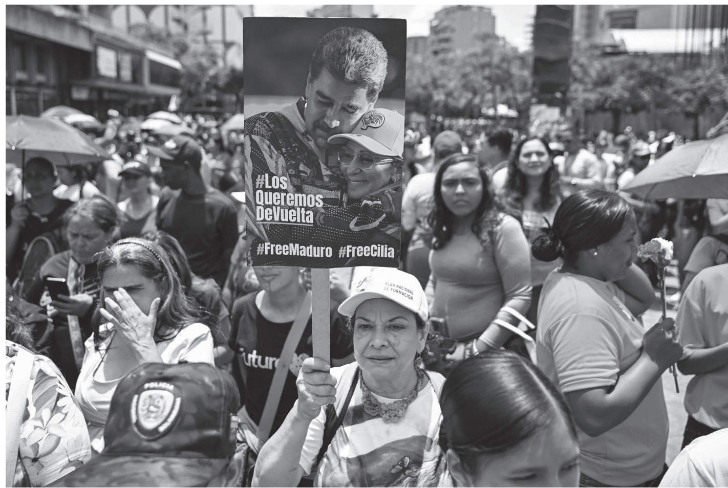
भेनेजुयलाको राजधानी कराकासमा अन्तरिम राष्ट्रपति डेल्सी रोड्रिगेजको समर्थनमा र अपहरित राष्ट्रपति निकोलस मादुरो र प्रथम महिला सिलिया फ्लोरेसको रिहाइको निमित्त भएको प्रदर्शनमा मादुरो र उहाँकी पत्नीको तस्बिरसहित उत्रेका महिलाहरू २० अप्रिल २०२६ का दिन । नोबेल पुरस्कारप्राप्त विपक्षी नेतृ कोरिना माचाडोले स्पेनेको राजधानी म्याड्रिडमा गरेको भूटो जनप्रदर्शनको विरोधमा काराकसमा विशाल जनप्रदर्शन भएको हो ।