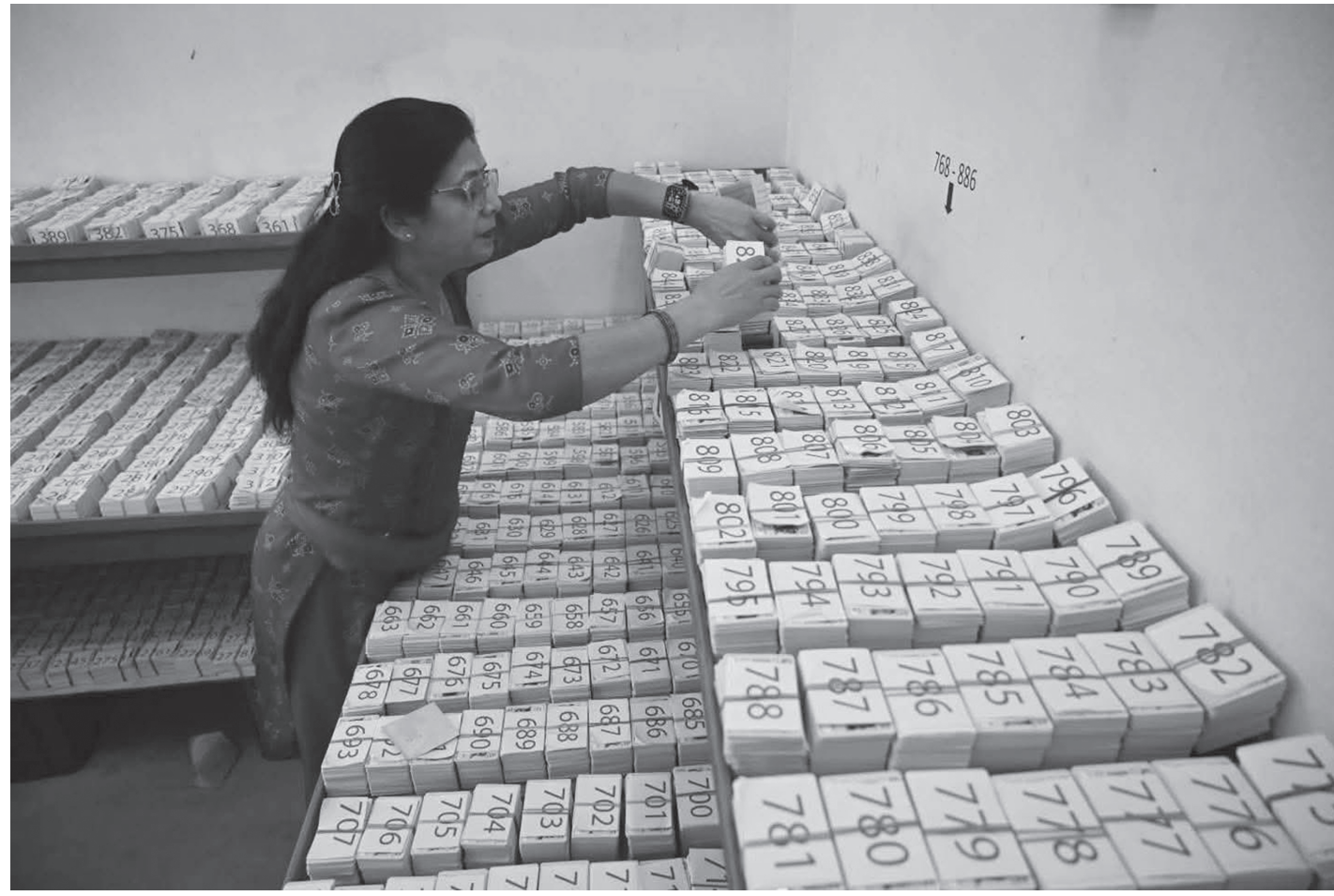
यातायात व्यवस्था कार्यालय भक्तपुरका एक कर्मचारी नयाँ सवारी लाइसेन्स वितरणका लागि मिलाउँदै। लामो प्रतिक्षापछि यातायात व्यवस्था कार्यालय भक्तपुरले सन् २०२२ देखि २०२५ सम्मका लाइसेन्स वितरण कार्य सुरु गरेको छ।