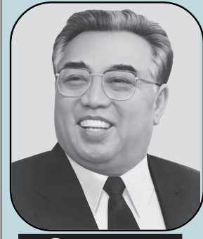
-किम इल सङ

उत्पीडितवर्गका जनताले आफूलाई सङ्घर्षको माध्यमबाट मात्र मुक्त गर्न सक्छ। यो इतिहासले ठोक्नुवा गरेको सामान्य र स्पष्ट सत्य हो।