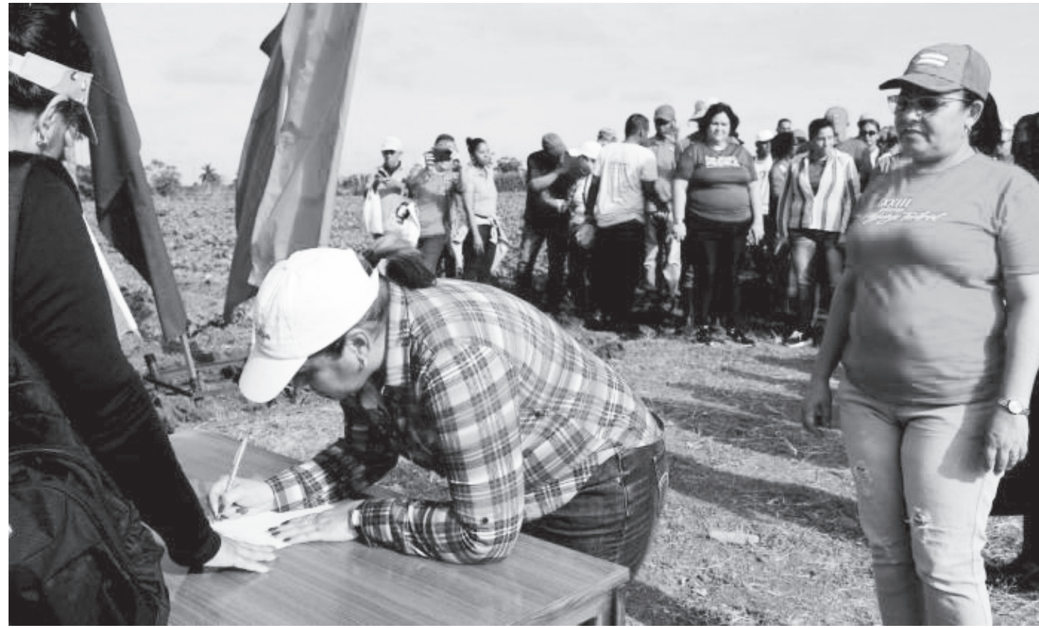
क्युवाको बायामो प्रान्तमा 'गृहभूमिका लागि मेरो हस्ताक्षर' अभियानका क्रममा हस्ताक्षर गर्न जम्मा भएका क्युवाली किसानहरू अप्रिल १९, २०२६ का दिन। अमेरिकी सैनिक आक्रमणको सामना गर्न र शान्ति तथा समाजवादी क्रान्तिको रक्षाका निमित्त उक्त हस्ताक्षर अभियान क्युवाभरि चलिरहेको छ। तस्बिर : ग्रान्मा इन्टरनेशनल

वर्ष ३३ * अङ्क १३ * ८ वैशाख २०८३, मङ्गलबार * 21 April 2026, Tuesday * मूल्य रु. १०/-