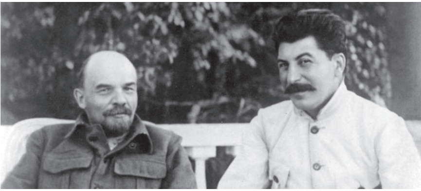
लेनिन र स्टालिन

(विभिन्न पुस्तक र पत्रपत्रिकाका आधारमा सम्पादित)