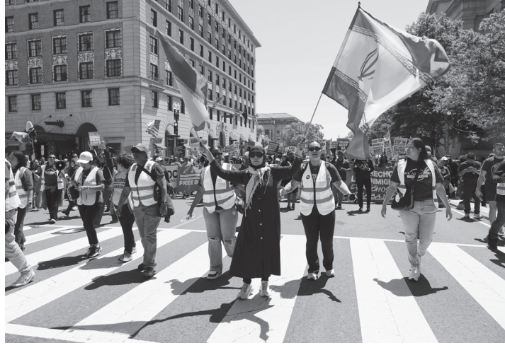
वासिङ्टन, संरा अमेरिका