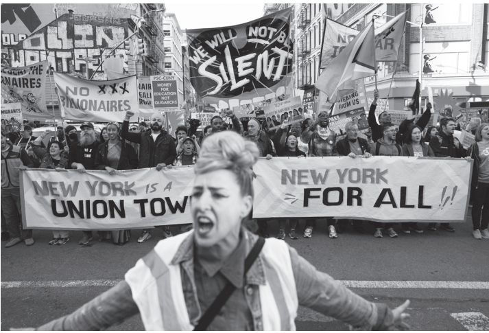
न्युयोर्क, संरा अमेरिका