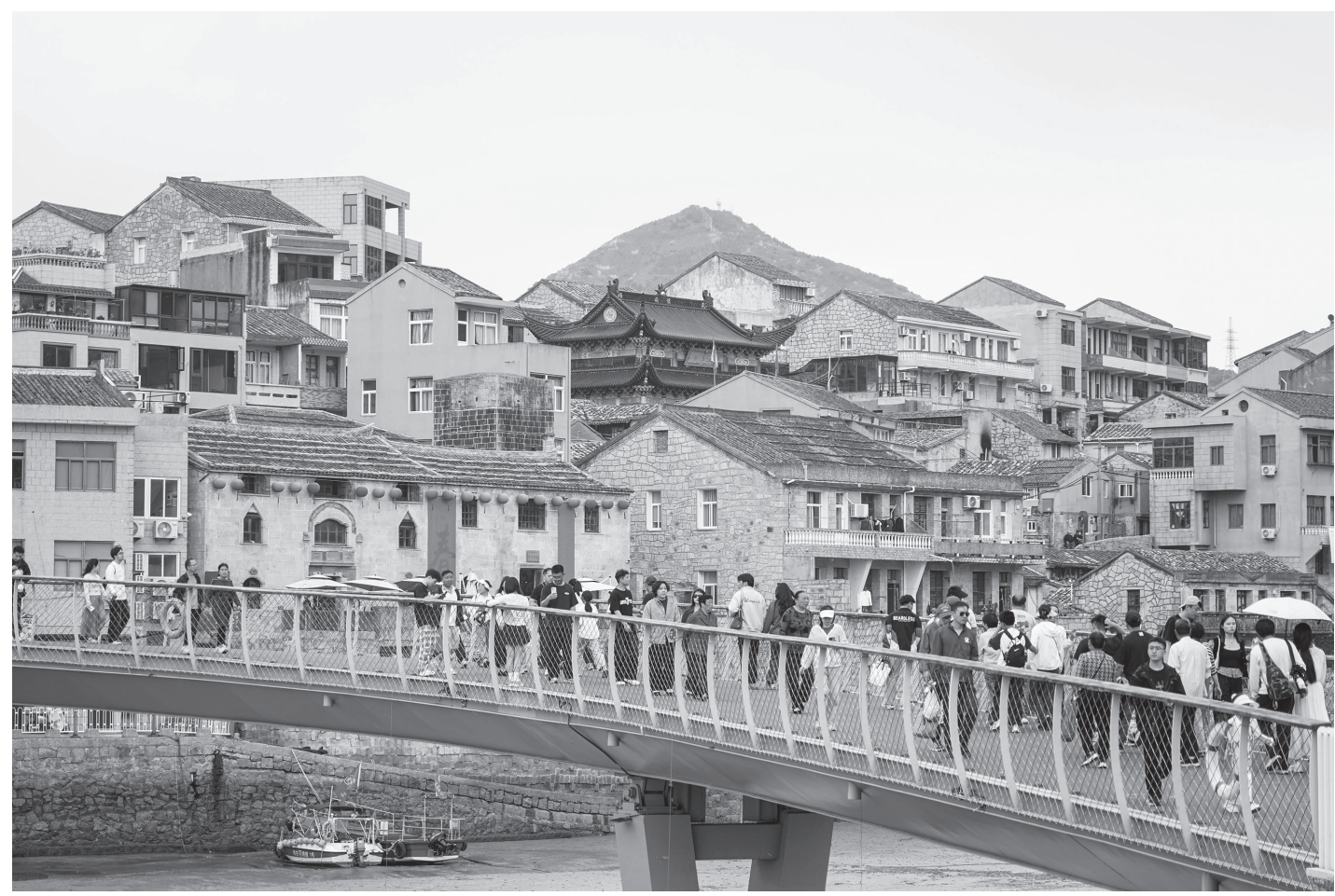
चीनको पूर्वी भेजियाङ प्रान्तको वेनलिङ सहरमा रहेको शिताङ सहरमा मे २, २०२६ मा मानिसहरू परम्परागत ढुङ्गाका घरहरू हेर्दै छन्। शिताङ सहर तीनतिर समुद्रले घेरिएको परम्परागत माछा माने बन्दरगाह हो। यस वर्षको मे दिवस विदाको समयमा यहाँ माछा माने संस्कृतिसँग सम्बन्धित विभिन्न कार्यक्रमहरू आयोजना गरिए, जसले देशभरबाट पर्यटकहरू आकर्षित गर्‍यो।