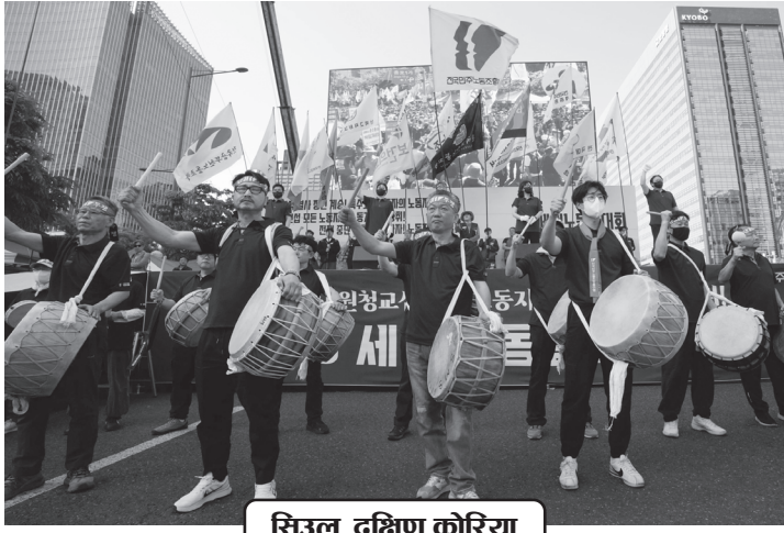
सिउल, दक्षिण कोरिया