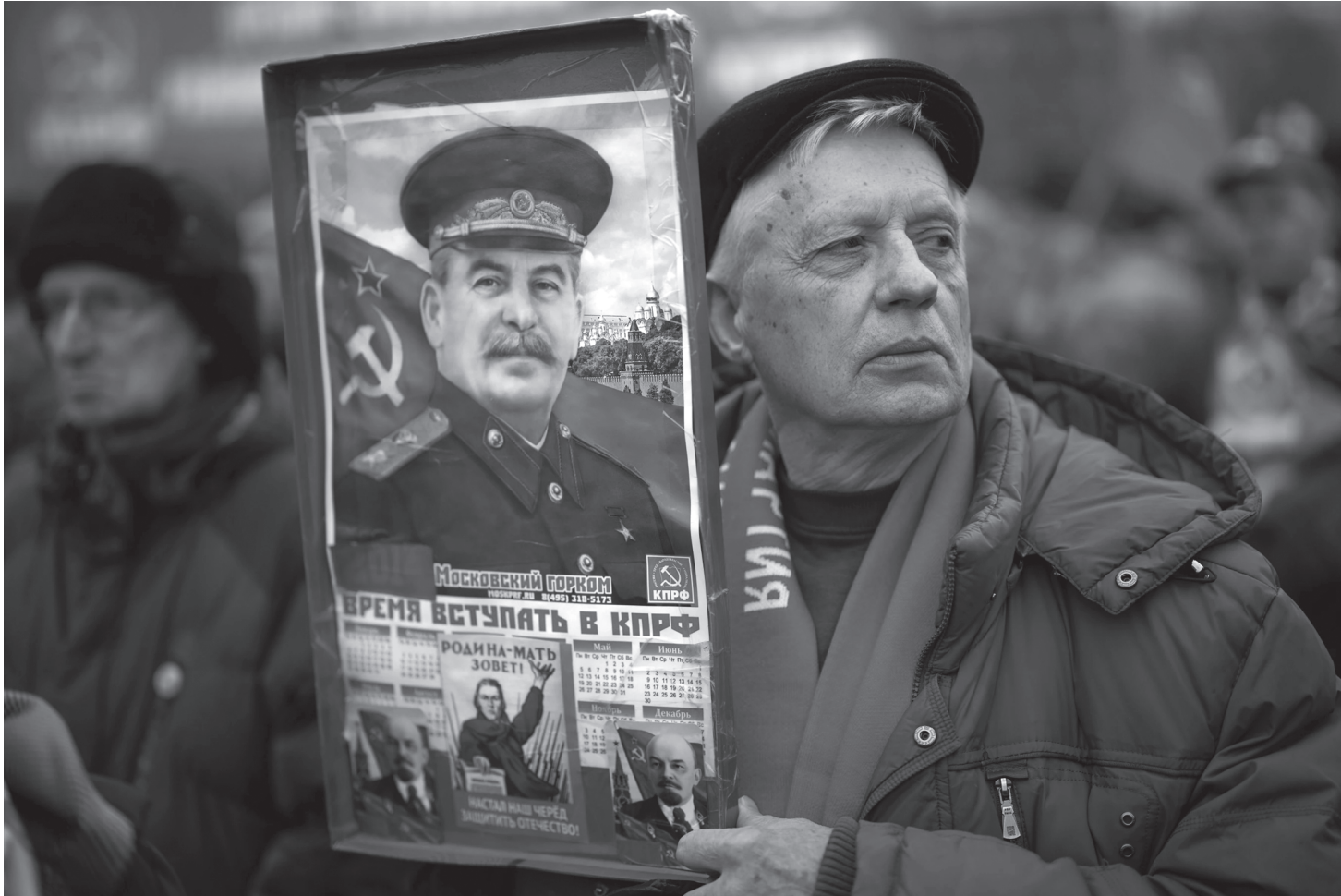
मजदुर दिवस मनाउन रुसको राजधानी मस्कोको लालचोकनिर रहेको कार्ल मार्क्सको स्मारकनजिक जम्मा भएका रुसी कम्युनिस्ट पार्टी र तिनका समर्थकहरूको जुलुसमा सोभियत नेता जोसेफ स्तालिनको तस्बिर बोकेका एक सहभागी । (२०२६ मे १, शुक्रबार ।)

★ वर्ष : २८ ★ अङ्क : १०१ ★ ने. सं. ११४६ बछला गा, तृतीया ★ सोमवार ★ २१ वैशाख, २०८३ ★ May 4, 2026, Monday ★ मूल्य रु. ५१- ★ पृष्ठ ८