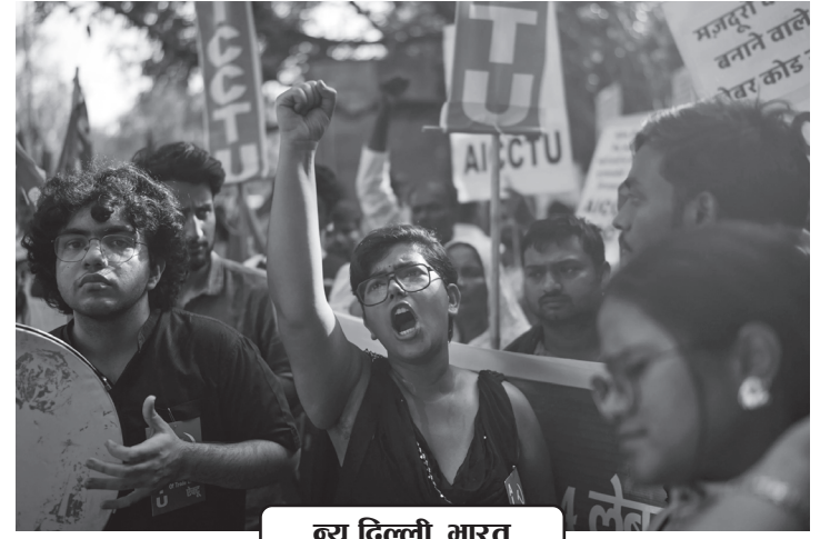
न्यू दिल्ली, भारत