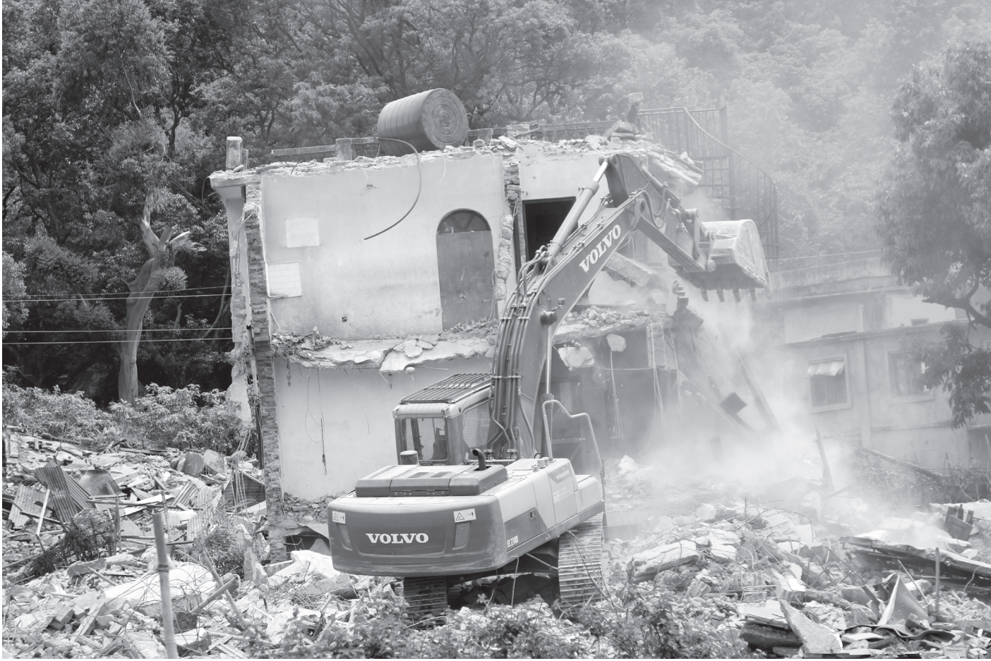
पशुपति क्षेत्रमा सार्वजनिक जग्गा अतिक्रमण गरी निर्माण गरिएका संरचना हटाइँदै

काठमाडौं महानगरपालिका-८ स्थित पशुपति क्षेत्रमा सार्वजनिक जग्गा अतिक्रमण गरी निर्माण गरिएका संरचना आइतबार हटाइँदै। शनिबारदेखि यहाँका अतिक्रमण संरचना हटाउन सुरु गरिएको हो।