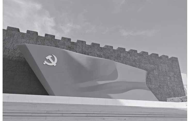
सङ्ग्रहालय बाहिर रहेको सीपीसीको विशाल झन्डा।

चौथो भाग भनेको चीन नयाँ युगमा प्रवेश गरेको समय हो। सन् २०१२ मा भएको सीपीसीको अठारौँ राष्ट्रिय महाधिवेशनबाट सी चीनफिङ सत्तामा आएपछिको समयलाई चीन नयाँ