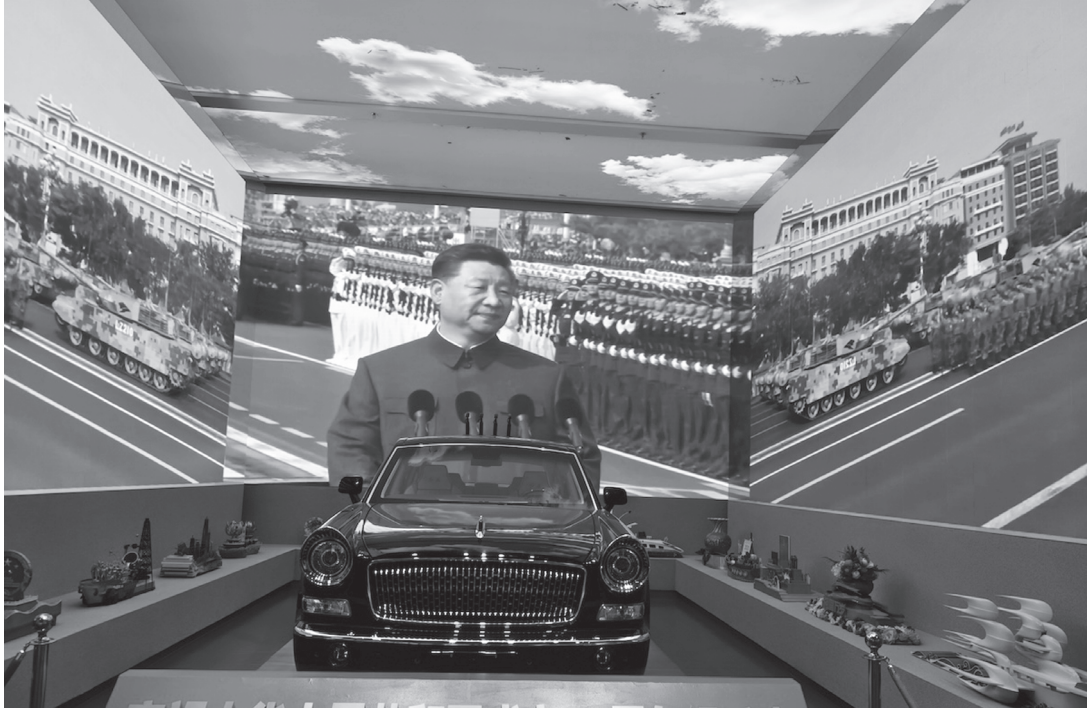
सी चीनफिङको कार्यकल र चीनको विकास फल्काउने दृश्य

यो सङ्ग्रहालयले सीपीसीको इतिहास नजिकबाट बुझ्न सहयोग गर्छ। चीनको इतिहास र सीपीसीको योगदानमा चासो राख्नेका लागि यो महत्त्वपूर्ण अध्ययन केन्द्र हुन सक्छ।