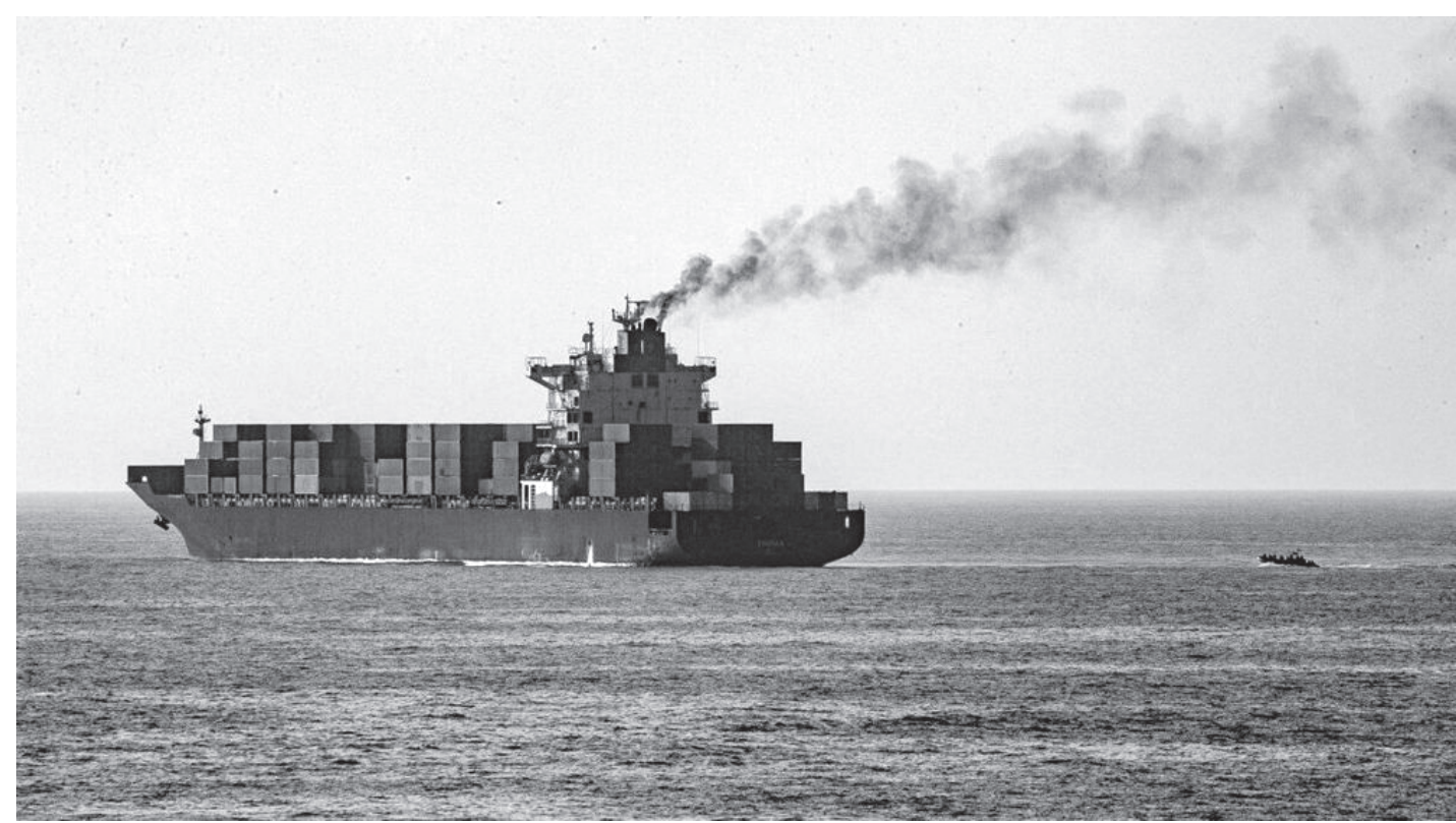
हर्मुज जलडमरु बन्द गर्नको लागि अमेरिकी जलसेनाले जलडमरुको मुखमा तेसाएर राखिएको मालवाहक जहाज ।