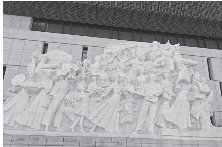
चीनको जनक्रान्ति भल्कने दुइगोचित्र

सीपीसीले एक वर्षको गौरवमय इतिहास सिर्जना गरेको उपलक्ष्यमा