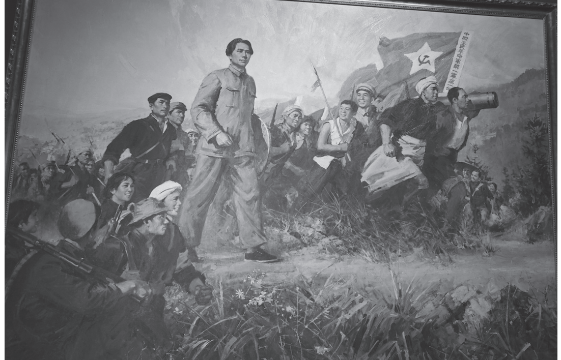
क्रान्ति र माओ