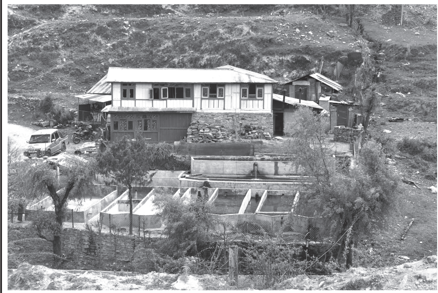
रेन्वो ट्राउट माछापालन

समुद्री सतहदेखि दुई हजार ६५० मिटरको उचाइमा रहेको रसुवाको गतलाडमा गरिएको रेन्वो ट्राउट माछापालन।