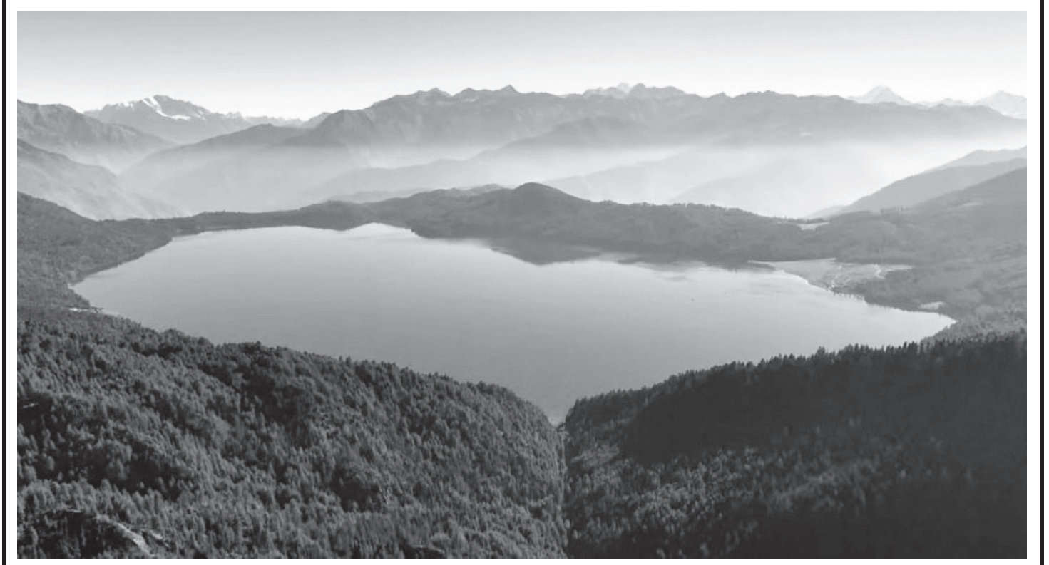
मुगुको छायानाथ रारा नगरपालिका -९ मा अवस्थित रारा ताल । उक्त ताल नेपालकै सबैभन्दा ठुलो र गहिरो ताल मानिन्छ ।

सरकारले लिएको सन् २०३० को लक्ष्य हासिल गर्न स्थानीय तहमा स्वास्थ्य पूर्वाधारको विकास, 'एन्टिस्नेक भेनम' को सहज उपलब्धता तथा स्वास्थ्यकर्मीको निरन्तर तालिम अपरिहार्य रहेको स्वास्थ्यकर्मी बताउँछन् । रासस