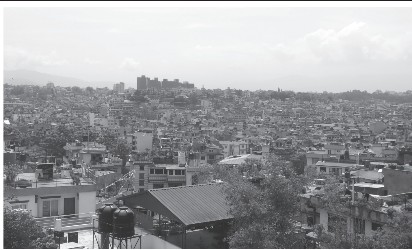
मनमैजुवाट देखिएको काठमाडौंको घना बस्ती

काठमाडौंको तारकेश्वर नगरपालिका-९ स्थित मनमैजुवाट मङ्गलबार मौसम खुल्दा देखिएको काठमाडौंको घना बस्ती।