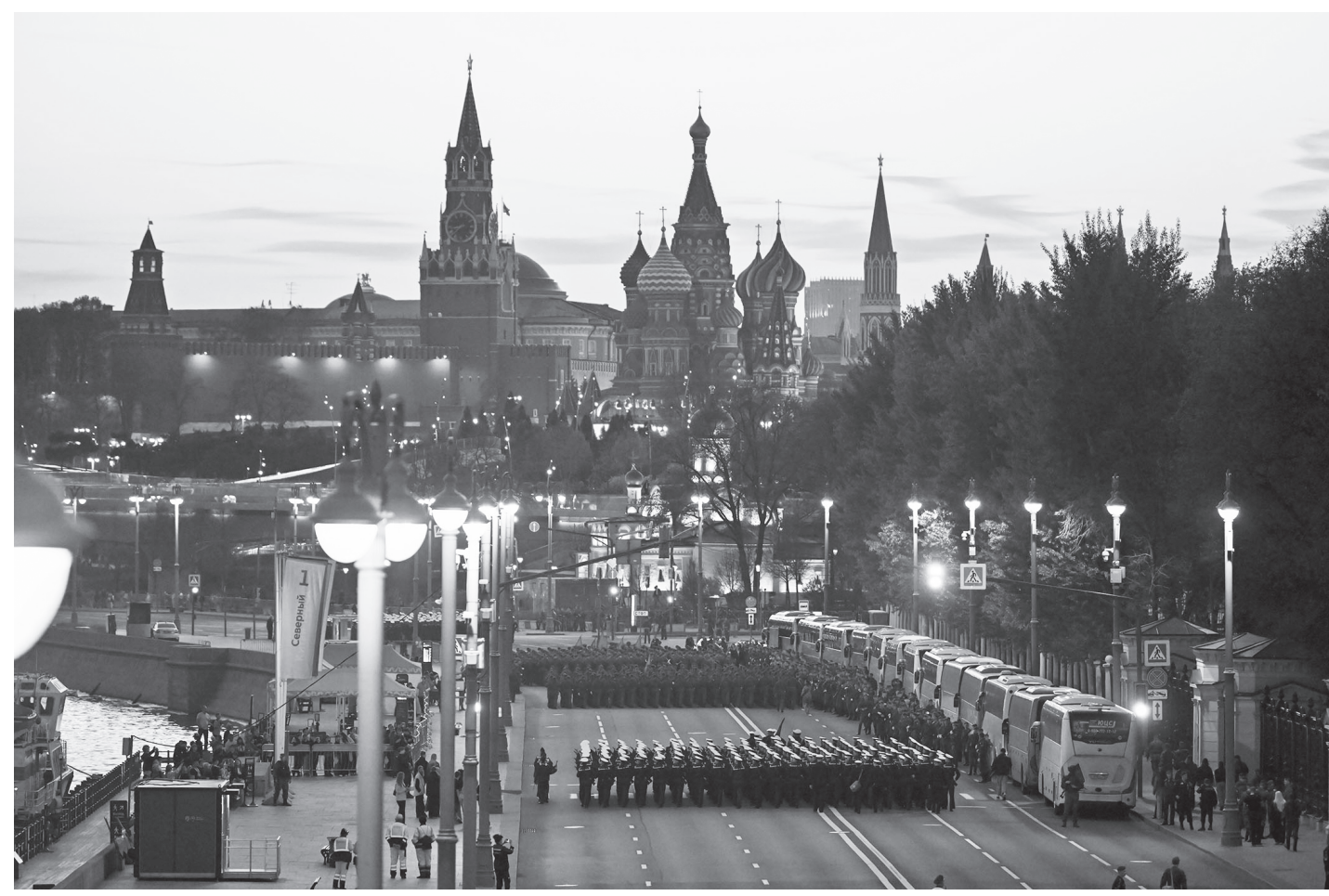
रुसको राजधानी मस्कोस्थित क्रेमलिन दरबार परिसरमा मे ९ का दिन हुने विजय दिवस परेडको रिहर्सल गर्दै रुसी सेनाहरू मे ४, २०२६ का दिन। तत्कालीन सोभियत लालसेनाले नाजी जर्मनीमाथि विजय प्राप्त गरेको दिनको सम्झनामा हरेक वर्ष मे ९ का दिन रुस र सोभियत गणतन्त्रहरूले विजय दिवस मनाउँदै आएका छन्।