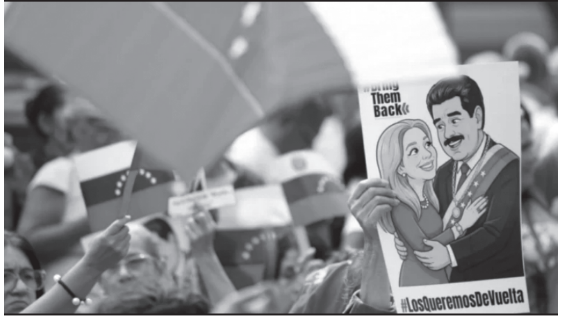
भेनेजुयाली राष्ट्रपति निकोलस मादुरो र प्रथम महिला सिलिया फ्लोरेसलाई संरा अमेरिकाले अपहरण गरेको १२१ औं दिन पारेर राजधानी काराकसमा ऐक्यबद्धता आन्दोलनको प्रदर्शनमा सहभागी भेनेजुयाली जनता मे ४, २०२६ का दिन ।