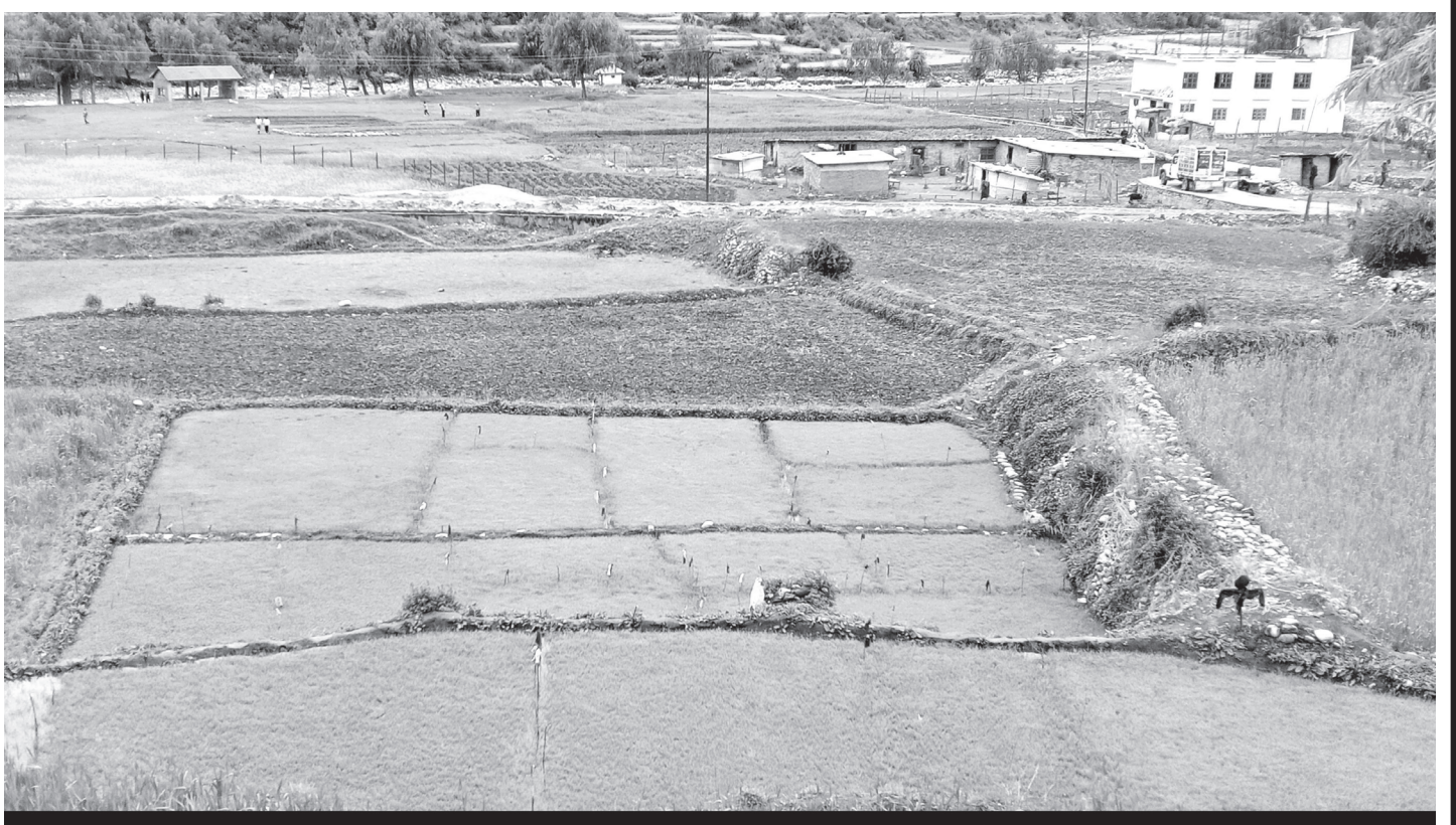
मासी धानको बीउ

रौतहटमा ४३ सामुदायिक वन, तीन साभेदारी वन, चार धार्मिक वन, एउटा ब्लक फरेस्ट व्यवस्थापन वन रहेको छ । रौतहटमा ३० हजार १७७ हेक्टर अर्थात् २९ प्रतिशत भूभाग वनक्षेत्रले ओगटेको छ जसमा सबैभन्दा बढी चन्द्रपुर, गुजरा, वृन्दावन र फतुवा विजयपुर नगरपालिकाको भू-भागमा वनक्षेत्र पर्दछ । प्रमुख साहले वन अतिक्रमण हटाउनका लागि आवश्यक काम अगाडि बढाइएको जानकारी दिनुभयो । राज्यको नीतिअनुसार अन्य क्षेत्रको पनि वन अतिक्रमण क्षेत्र हटाइने उहाँले जानकारी दिनुभयो । (रासस)