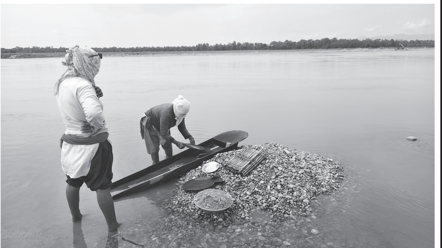
कर्णाली नदीमा सुन खोज्दै महिला : भजनी (कैलाली) । कैलाली र बर्दिया जिल्ला हुँदै बग्ने कर्णाली नदीमा सुन खोज्न नदीको बालुवा चाल्दै सोनाहा जातिका महिला ।

यासांगुम्बा दुर्गमका जनताको प्रमुख आर्थिक स्रोतका रूपमा रहेको छ । यहाँ जनता आफ्नो वर्षभरिको पारिवारिक खर्च यासांगुम्बा बिक्रीबाटै जुटाउने गर्दछन् । (रासस)