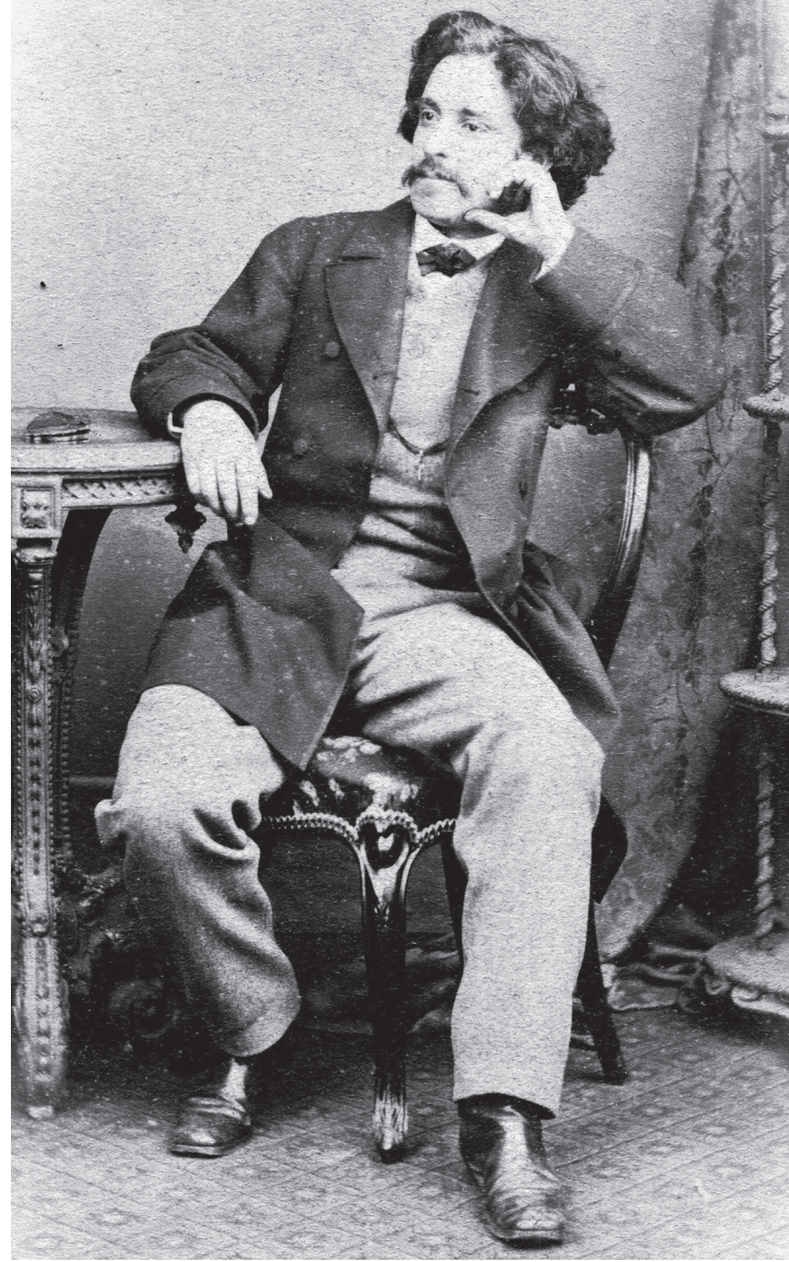
पाण्डुलिपिहरू साफि गर्नुहुन्थ्यो।

मार्क्स आफ्नी जहानको बुद्धिमत्ता र आलोचना शक्तिलाई अत्यन्त सम्मान गर्नुहुन्थ्यो। त्यसैले आफ्ना सबै पाण्डुलिपिहरू उहाँलाई देखाउनुहुन्थ्यो र उहाँको विचारलाई ठुलो महत्त्व दिनुहुन्थ्यो। यो कुरा सन् १९६६ मा मार्क्सले मसित भन्नुभएको थियो। छापाखानामा पठाउनुभन्दा अगाडि श्रीमती मार्क्सले आफ्ना पतिको