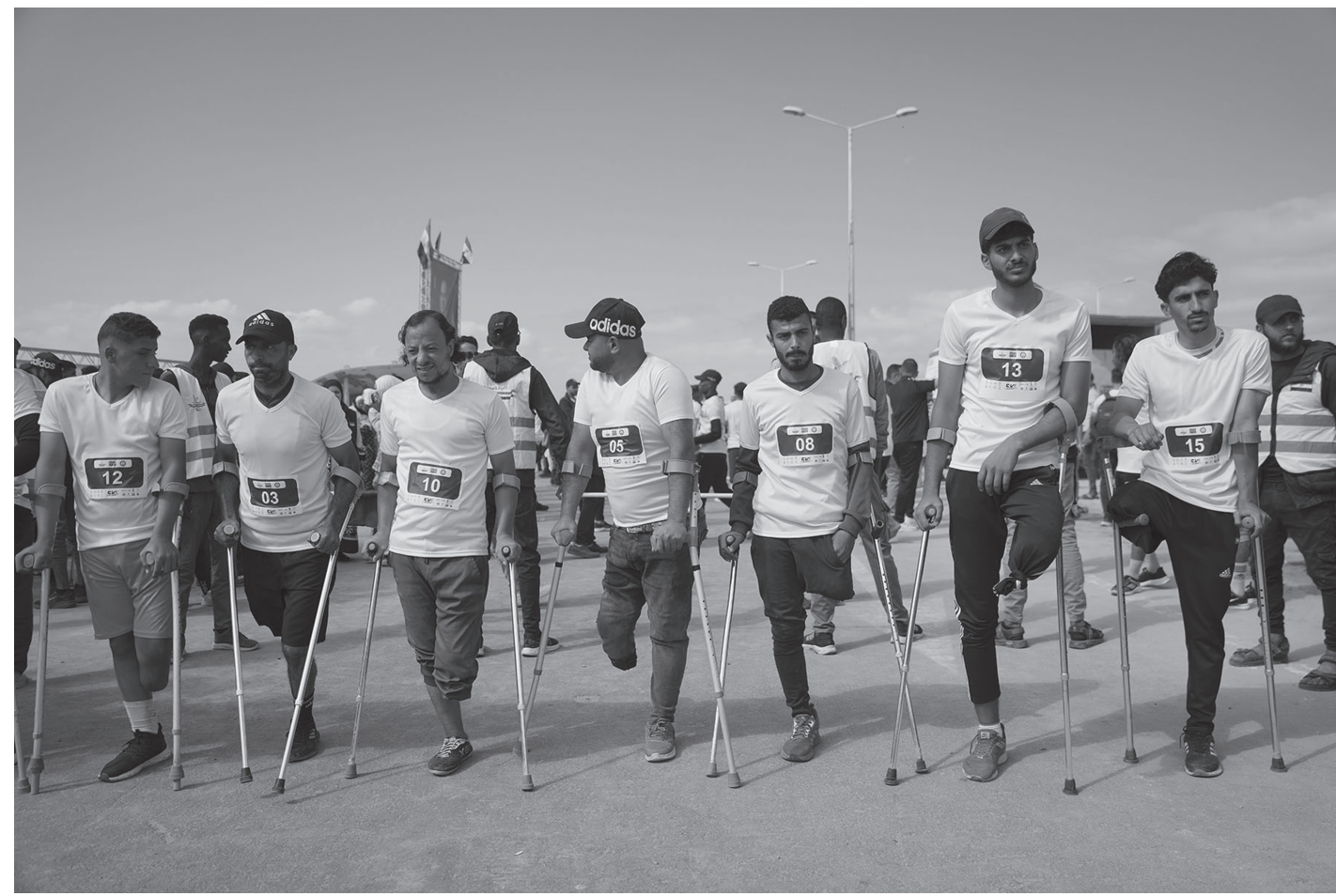
गाजापट्टीको मध्यभागमा अवस्थित नुसेरतमा कोस्टल सडकमा आयोजित ६ किलोमिटरको दौड प्रतियोगितामा भाग लिदै इजरायली हमलामा परी अपाङ्ग भएका प्यालेस्टिनी युवाहरू मे ८, २०२६ का दिन ।