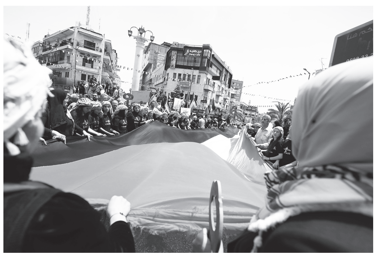
प्यालेस्टिनको वेस्ट ब्याङ्कस्थित रमल्लाह सहरमा ७८ औं वार्षिक नक्बा दिवसको अवसरमा प्रदर्शन गर्दै प्यालेस्टिनी जनता मे १२, २०२६ का दिन। सन् १९४८ को मे १५ का दिन बेलायत र संरा अमेरिकाको सहायतामा इजरायली सेनाले प्यालेस्टिनी सहर र गाउँमा गरेको नरसंहार र निष्काशनको सम्झनामा प्यालेस्टिनीहरूले हरेक वर्ष नक्बा डे मनाइरहेका छन्।