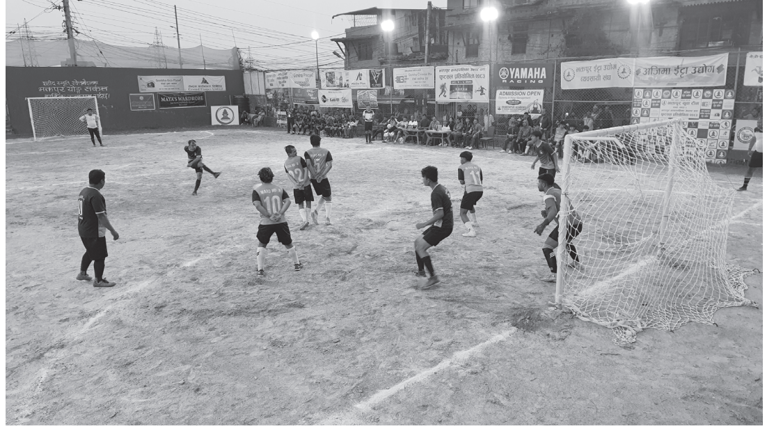
भक्तपुर युवा टीमको आयोजनामा २०८३ जेठ ६-१६ गते हुने भक्तपुर नगरपालिका अन्तरवडा फुटसल प्रतियोगिताअन्तर्गत आइतबार भनपा वडा नं. २ स्थित सहिद स्मृति खेल मैदानमा भएको खेलमा खेलेरहेका खेलाडी र दर्शकहरू।