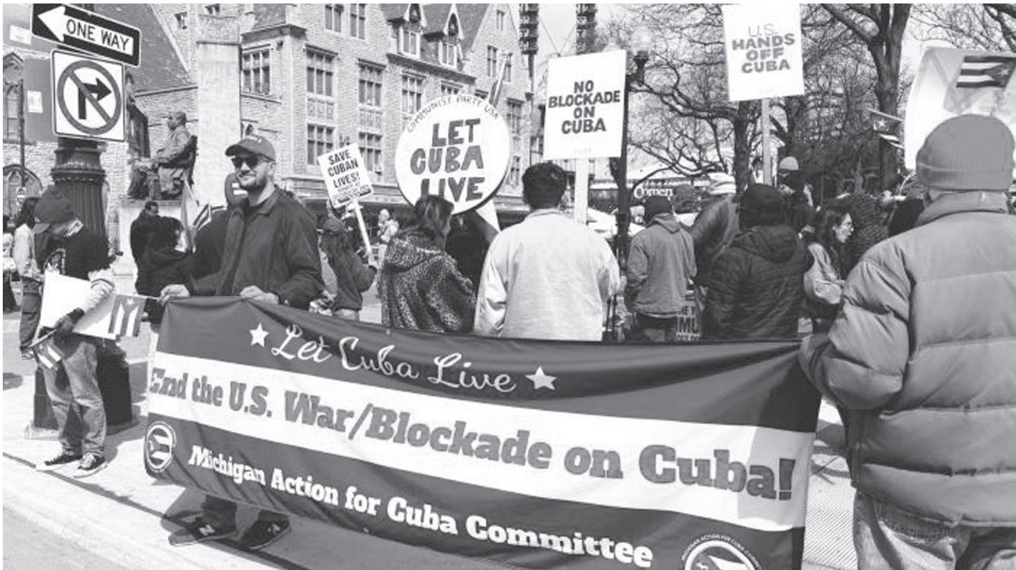
संरा अमेरिकाको मिचिगन राज्यको डेट्रोइट सहरमा क्युबामाथि संरा अमेरिकी सरकारले लगाएको क्रूर आर्थिक तथा व्यापारिक नाकाबन्दीको विरोध गर्दै 'क्युबालाई बाँच्न देऊ' भन्ने नाराका साथ प्रदर्शनमा उत्रेका अमेरिकी कम्युनिस्टहरू मे २३, २०२४ को दिन । संरा अमेरिकी सरकारले क्युबामाथि लगाएको नाकाबन्दीलाई कडा पाउँदै सैनिक आक्रमणको समेत तयारी गरेको छ ।

★ वर्ष : २८ ★ अङ्क : १२२ ★ नं. सं. ११४६ अनाला थ्व, नवमी ★ सोमवार ★ ११ जेठ, २०८३ ★ May 25, 2026, Monday ★ मूल्य रु. ५१- ★ पृष्ठ ८