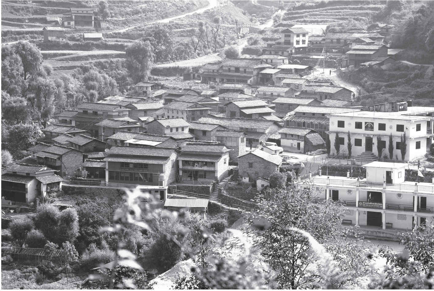
मौलिक घर : बागलुङको तमानखोला गाउँपालिका-३ स्थित तमान गाउँका परम्परागत मौलिक घरहरू। तमान गाउँलाई पालिकाले मौलिक गाउँको रूपमा विकास गर्ने उद्देश्य लिएको छ।