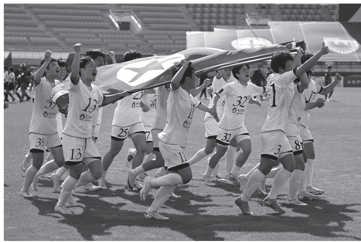
दक्षिण कोरियाको सुवोनमा सम्पन्न एएफसी महिला च्याम्पियन्स लिग फुटबल प्रतियोगिताको फाइनल खेलमा जापानको टोक्यो भेजेजा क्यलबलाई पराजित गरेपछि खुसी मनाउँदै प्रजातान्त्रिक जनगणतन्त्र (उत्तर) कोरियाको नाइगोह्याङ महिला फुटबल क्लबका खेलाडीहरू म २३, २०२६ को दिन। फुटबल खेलमा प्रजा कोरियाका खेलाडीहरू अब्बल सावित हुँदै आएका छन्।