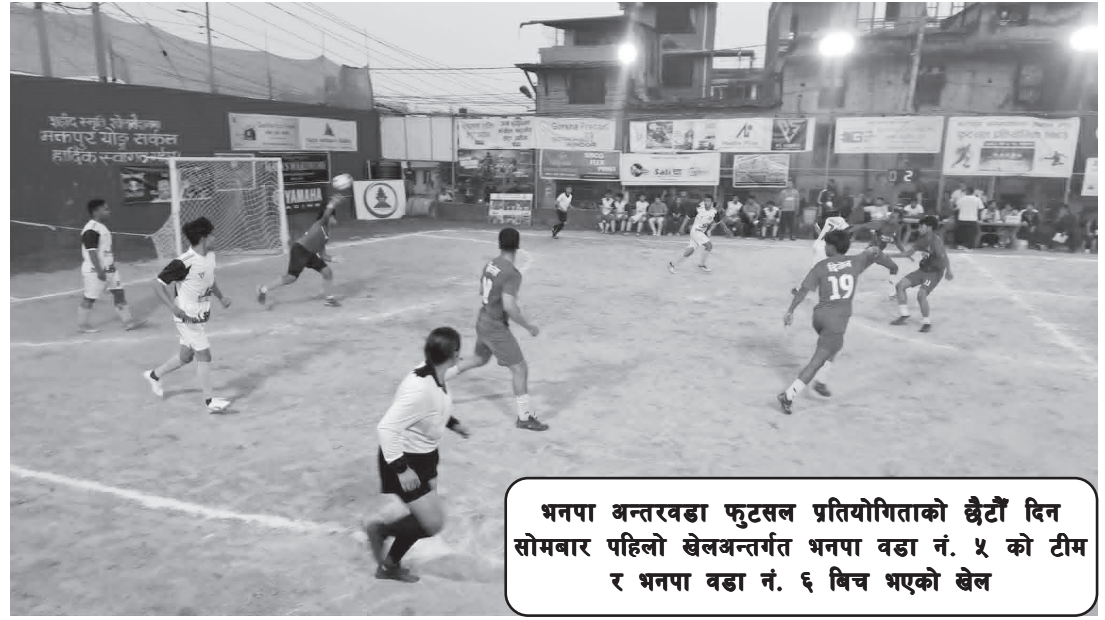
भनपा अन्तरवडा फुटसल प्रतियोगिताको छैटौं दिन सोमबार पहिलो खेलअन्तर्गत भनपा वडा नं. ५ को टीम र भनपा वडा नं. ६ बिच भएको खेल

प्रतियोगिताको फाइनल तथा समापन समारोह जेठ १६ गते शनिबार