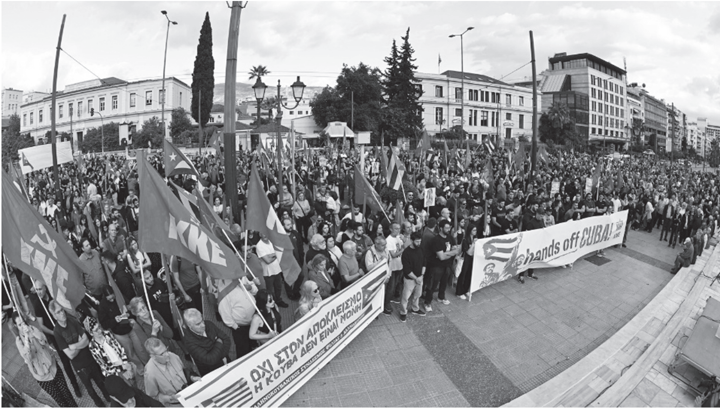
ग्रीसको राजधानी एथेन्सको सिन्टामा स्वयंसेवक समाजवादी क्युवाका वीर जनताप्रति ऐक्यबद्धता र साम्राज्यवादको विरोध गर्दै प्रदर्शनमा उत्रेका ग्रीक जनता मे २३, २०२६ को साँझ । ग्रीक कम्युनिस्ट पार्टी (केकेई) र ग्रीक योड कम्युनिस्ट लिगको आयोजनामा भएको प्रदर्शनमा 'क्युवा एक्लो छैन' र 'साम्राज्यवादी धम्की सफल हुने छैन' चर्को नारा लगाइएको थियो ।