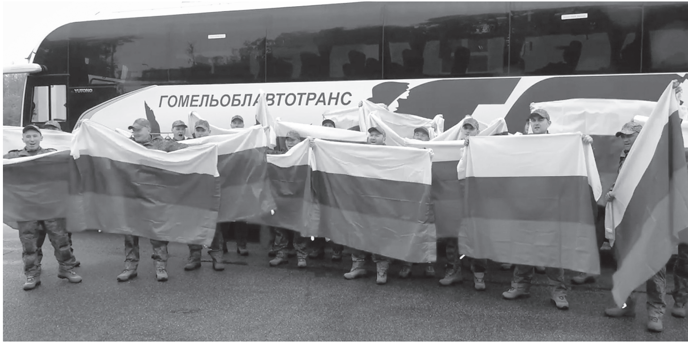
युक्रेन र बेलायतको सिमानामा रुस र युक्रेनबिचको युद्धबन्दी साटासाटपछि रुसी फन्डा फहराउँदै रुसी सेनाका मुक्त सदस्यहरू

किएभ, १५ मे (एएफपी)। रुस र युक्रेनले शुक्रबार २०५-२०५ जना युद्धबन्दी आदानप्रदान गरेका छन्। लामो समयदेखि जारी युद्धबिच कैदी साटासाटलाई दुवै पक्षबिच बाँकी रहेका सीमित मानवीय सहकार्यहरूमध्ये एक मानिएको छ। अमेरिकी राष्ट्रपति डोनाल्ड ट्रम्पले एक साताअघि ठुलो स्तरको युद्धबन्दी आदानप्रदानको घोषणा गरेपछि भएको यो पहिलो चरणको विनिमय हो।