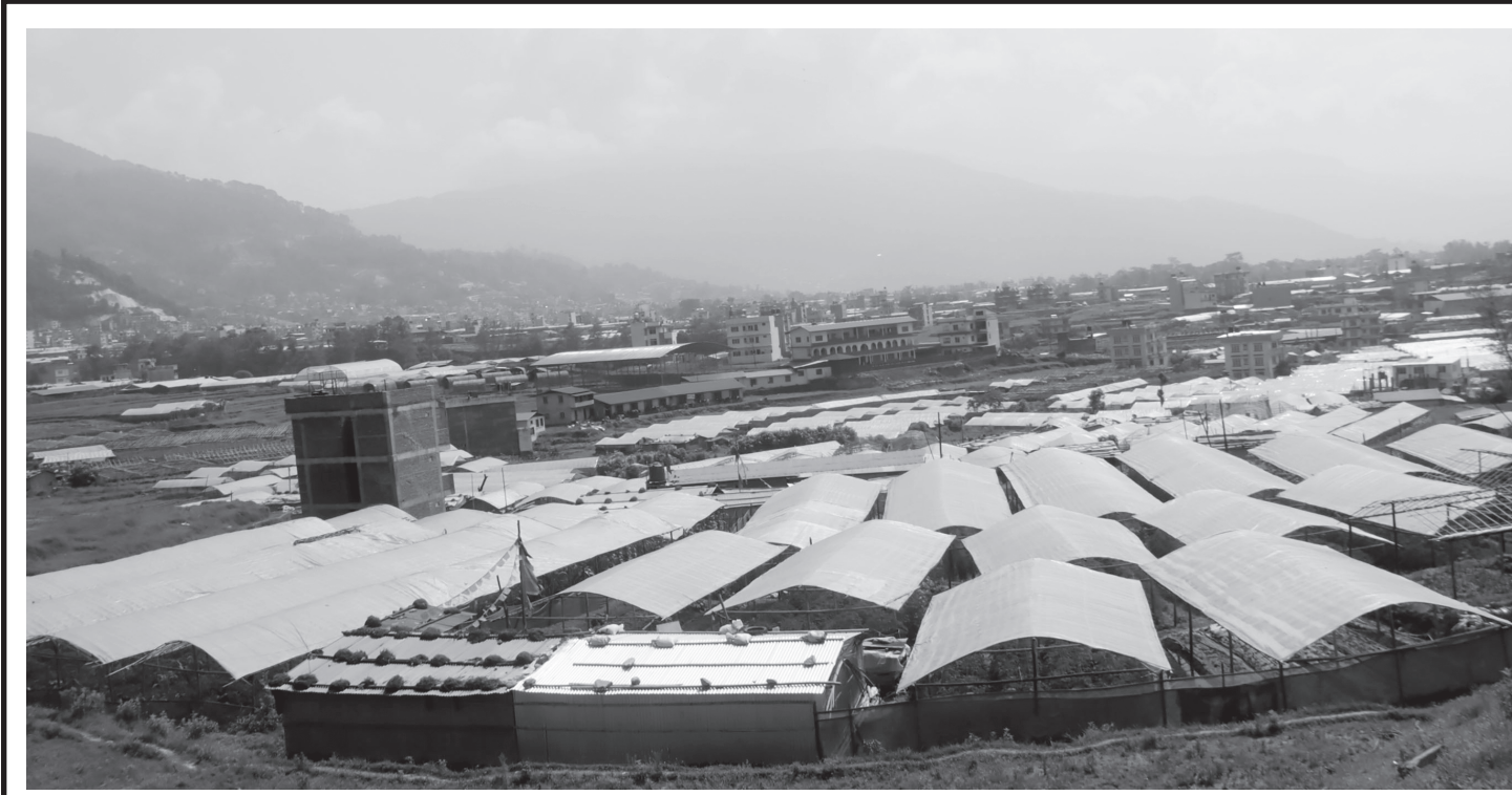
तरकारी खेतीका लागि टनेल : काठमाडौंको तारकेश्वर नगरपालिका-३ चिसापानीस्थित खेतमा व्यावसायिक रूपमा मौसमी तथा बेमौसमी तरकारी खेती गर्न किसानले निर्माण गरेको टनेल ।