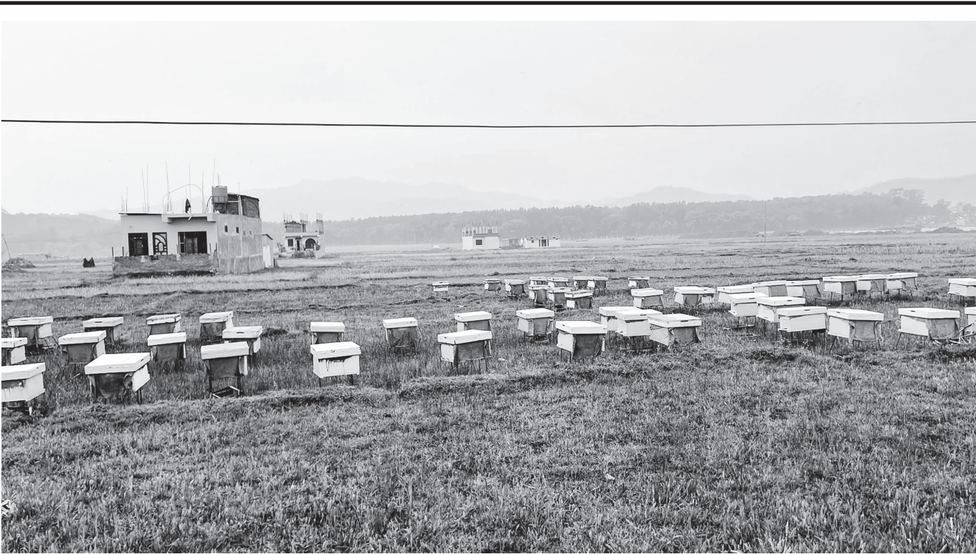
चरनका लागि राखिएको मौरि

समयमै मूल्य समायोजन नभए विकास आयोजनाहरू प्रभावित हुने र निर्माण नै ठप्प हुने परिस्थिति सृजना भएको भन्दै उहाँले निर्माण व्यवसायीहरूले बैंक ग्यारेन्टी, बिमा, धरौटी तथा पेस्कीसम्बन्धी व्यवस्थामा सहजीकरण गर्न सरकारसँग अनुरोध गर्नुभयो। (रासस)