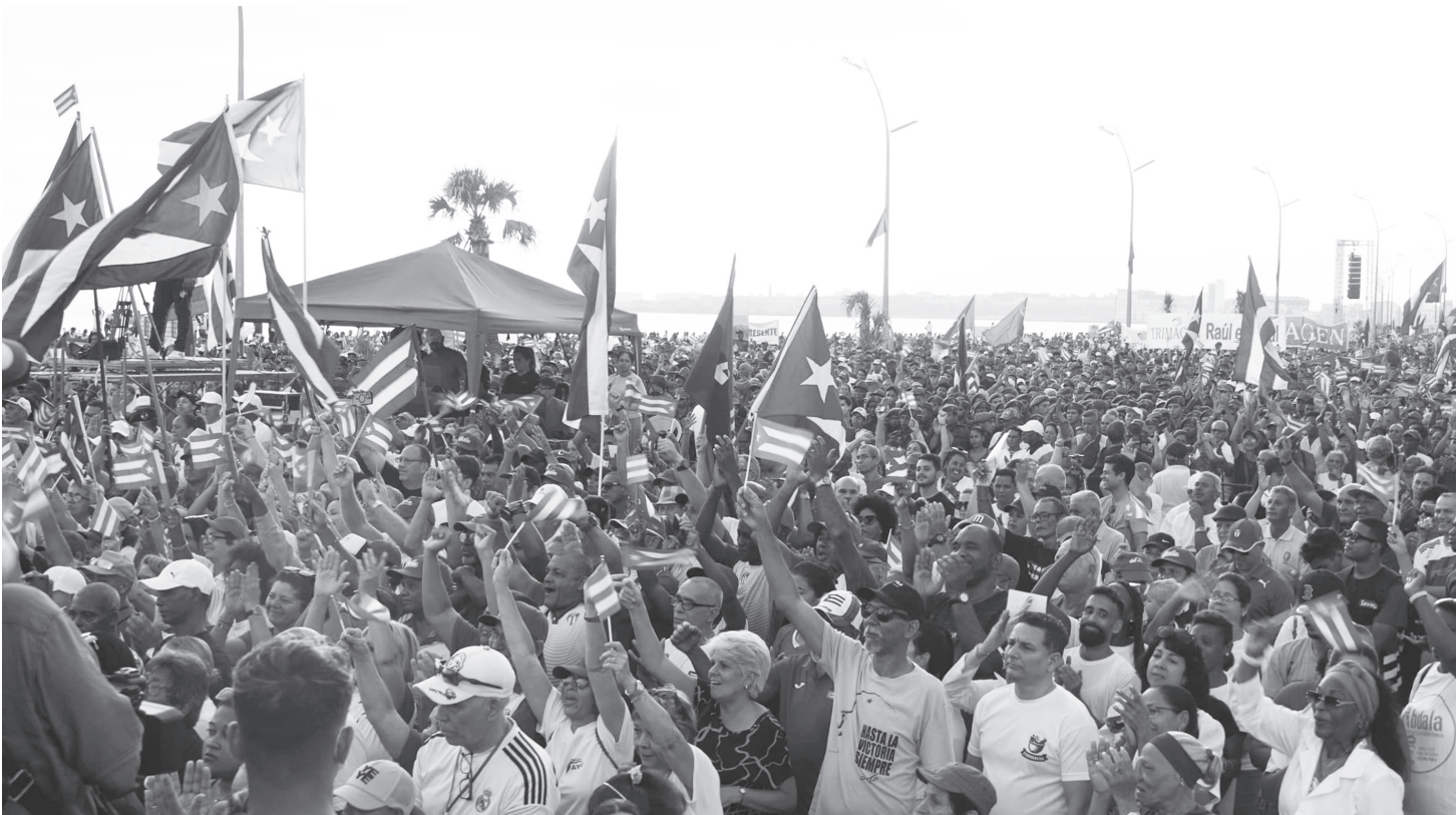
अमेरिकी साम्राज्यवादले क्युवाका पूर्वराष्ट्रपति नेता राउल क्यास्ट्रोमाथि भूटा ज्यान मुद्दा लगाएपछि साम्राज्यवादको विरोधमा र नेता क्यास्ट्रोप्रति ऐक्यबद्धता जनाउँदै क्युवाली राष्ट्रिय भन्डाका साथ प्रदर्शनमा उत्रेका हजारौं क्युवाली जनता मे २९, २०२६ का दिन ।