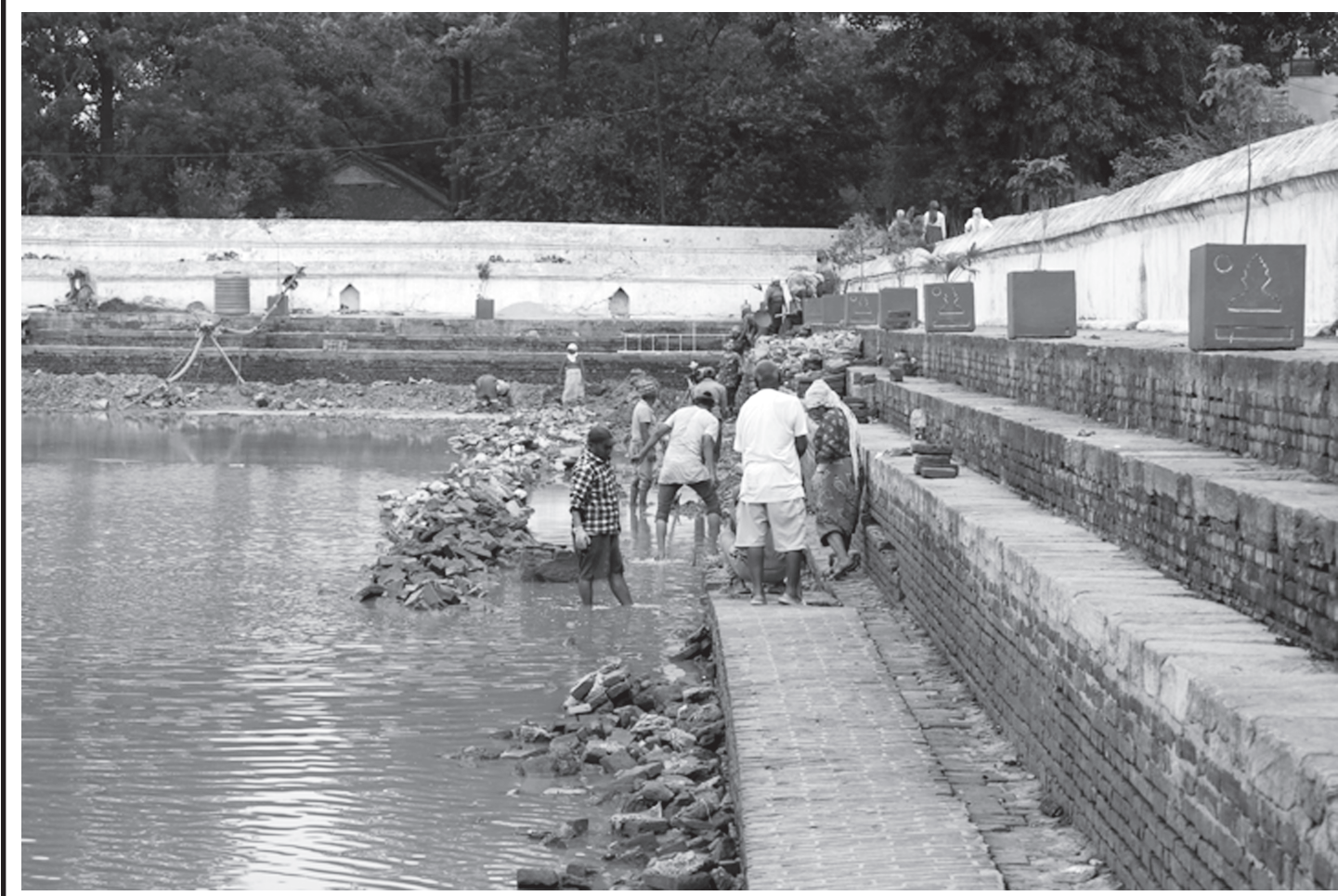
भक्तपुरको ऐतिहासिक पहिचान बोकेको सिद्धपोखरीको मर्मत कार्य भइरहेको छ । पोखरीमा रहेको पानी सुकाएर पोखरीको मर्मतसम्भार भइरहेको हो ।