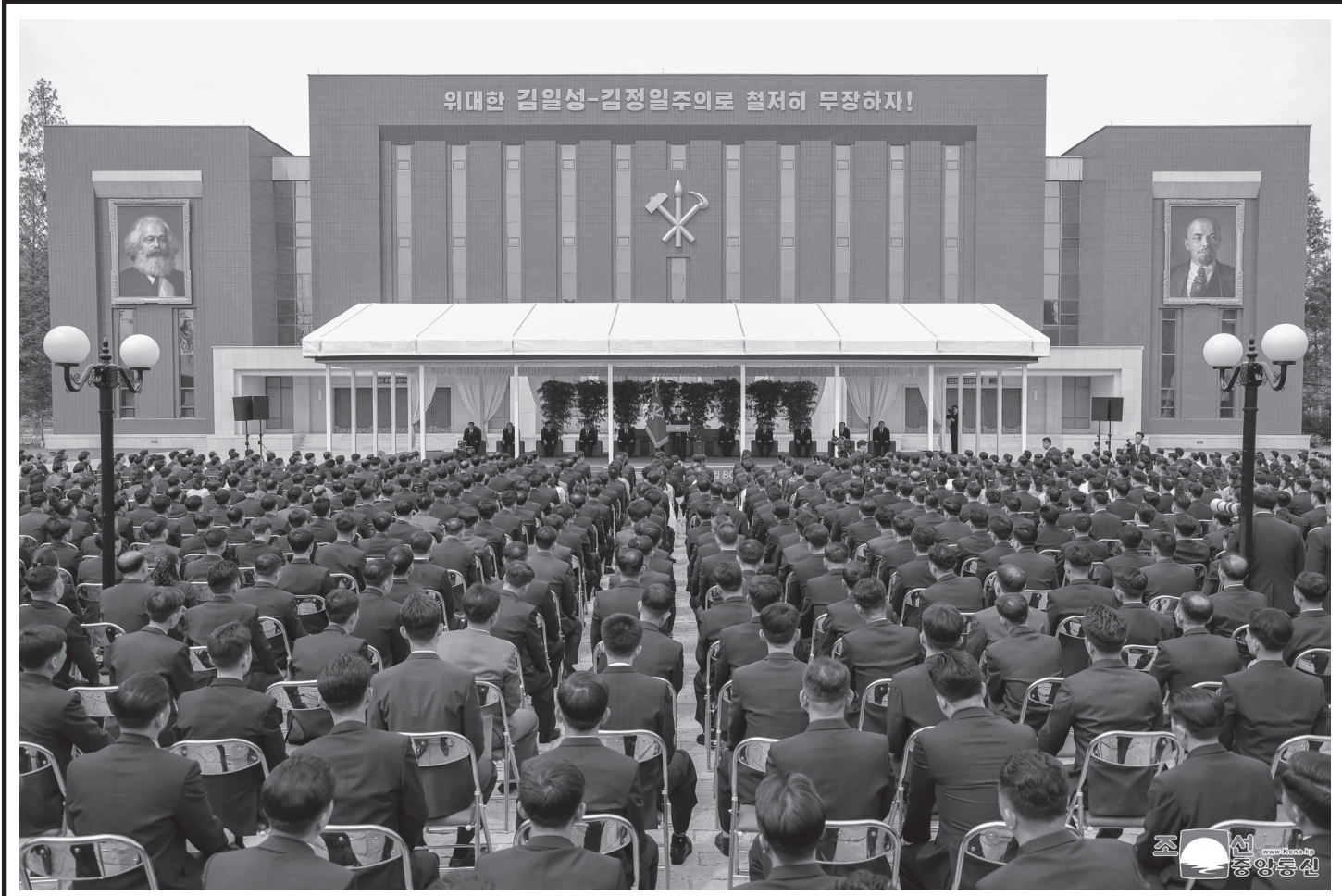
प्रजातान्त्रिक जन गणतन्त्र कोरियाको राजधानी प्योङयाङस्थित केन्द्रीय पार्टी कार्यकर्ता तालिम विद्यालयको ८० औं स्थापना दिवसको अवसरमा आयोजित समारोहलाई सम्बोधन गर्दै कोरियाली मजदुर पार्टीका महासचिव एवं प्रजग कोरिया राष्ट्रिय मामिला आयोगका अध्यक्ष मार्शल किम जोङ उन २ जून २०२६ का दिन ।