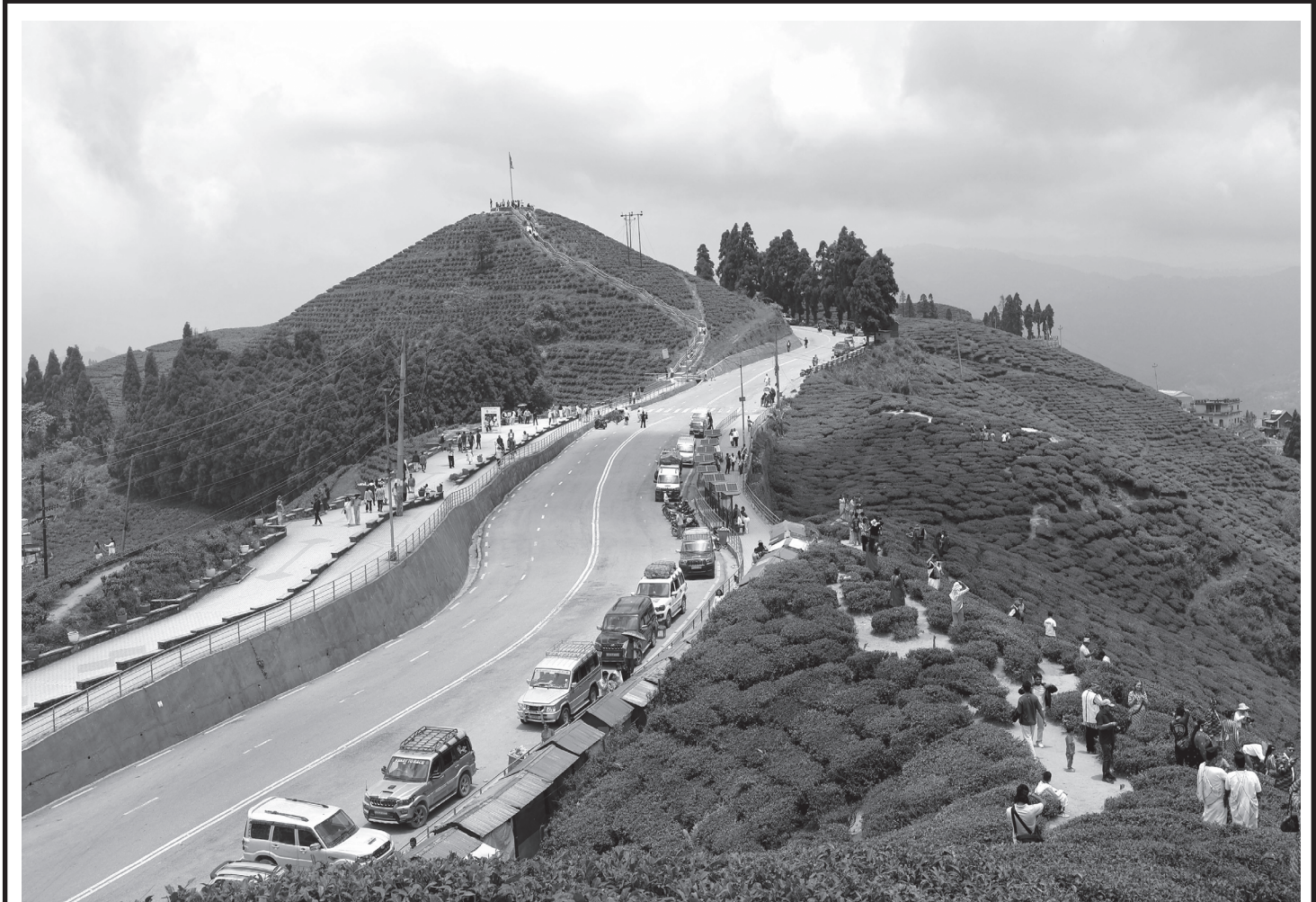
कन्याम चिया बगान

हेल्पलाइन (१०९८) वा प्रहरी हेल्पलाइन (१०४) मा बालविवाह, हिंसा वा शोषणसम्बन्धी सूचना दर्ता भएपछि बालबालिकालाई संरक्षण, उद्धार र