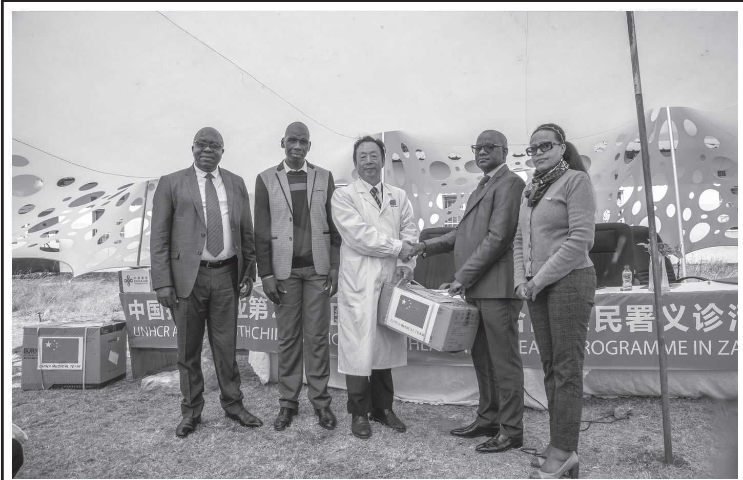
अफ्रिकी राष्ट्र जाम्बियाको राजधानी लुसाकास्थित म्याकेनी शरणार्थी ट्रान्जिट सेन्टरमा शरणार्थी मामिलासम्बन्धी संयुक्त राष्ट्रसङ्घीय उच्चायुक्तका प्रतिनिधिलाई चिकित्सा सामग्री सहयोग हस्तान्तरण गर्दै २६ औं चिनियाँ चिकित्सा टिमका नेता फाङ यिङजियानलगायत जून २, २०२६ का दिन। जाम्बियामा रहेको म्याकेनी शरणार्थी ट्रान्जिट सेन्टरमा विभिन्न अफ्रिकी देशबाट आएका शरणार्थीहरूको निःशुल्क स्वास्थ्योपचार चिनियाँलगायत विभिन्न देशका स्वयंसेवी चिकित्सकहरूले गर्दै आएका छन्।