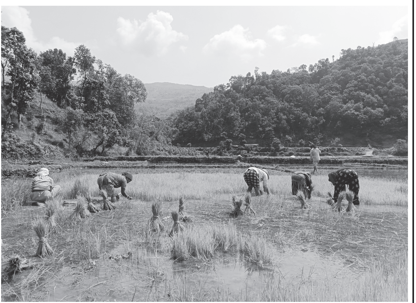
रोपाईका लागि बीउ काढ्दै किसान