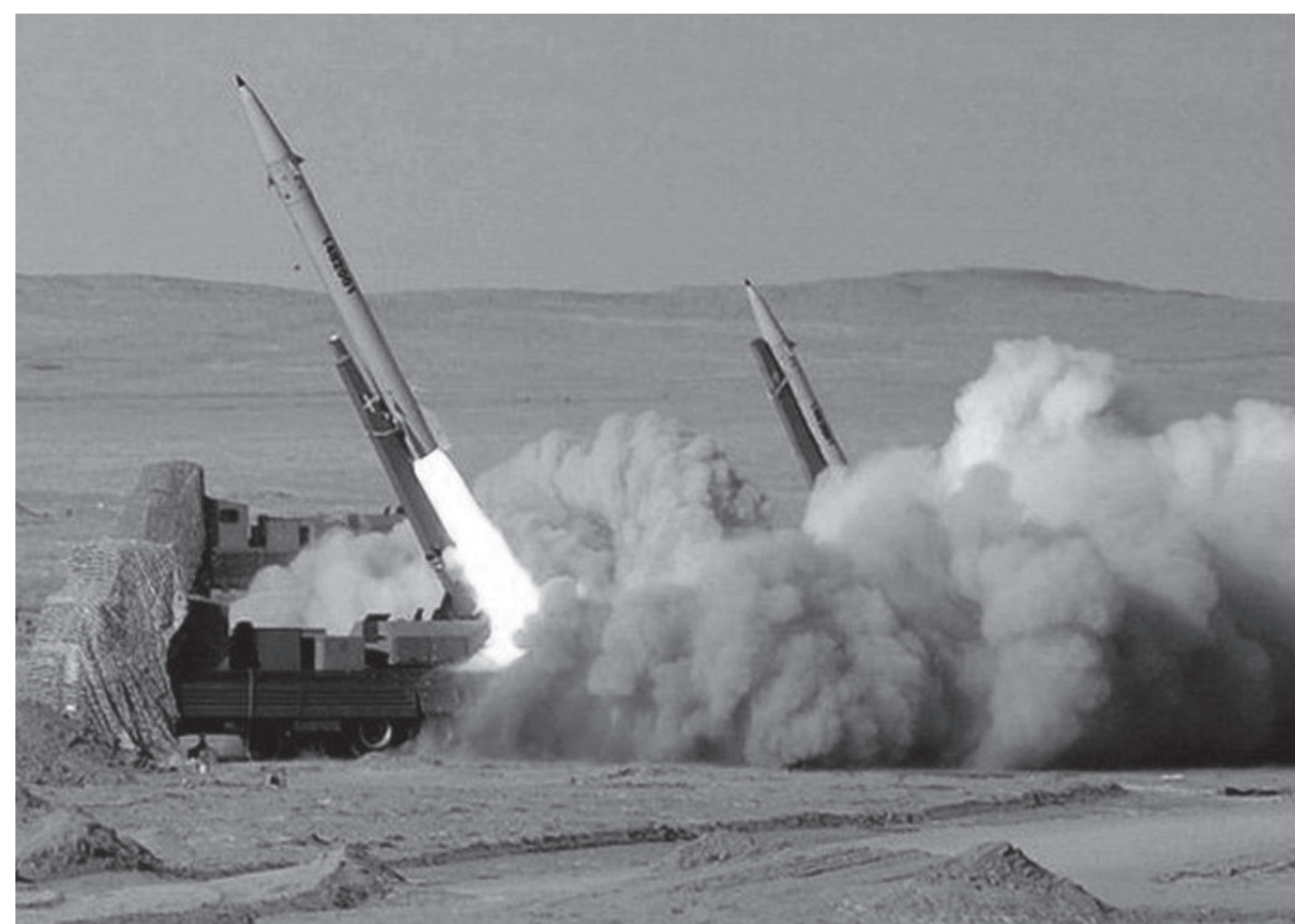
इरानको पश्चिमी क्षेत्रबाट निर्धारित लक्ष्यमा पुऱ्याउनका लागि प्रक्षेपण गरिएका मिसाइलहरू जून ६, २०२६ का दिन।