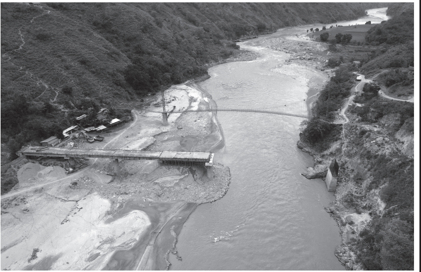
तेह्रथुम र पाँचथर जोड्ने निर्माणाधीन लुमुघाट पुल तेह्रथुम र पाँचथर जोड्ने तमोर नदीमा निर्माणाधीन लुमुघाट मोटरेबल पुल । १३ वर्षअघि निर्माण सुरु भएको पुल अझै निर्माण सम्पन्न हुन सकेको छैन ।

यसै चौदण्डीगढी नगरपालिका-९ ज्यमिरेका कृषक धनपति पौडेलका अनुसार उदयपुरमा असारको तेस्रो हप्तादेखि साउनको तेस्रो हप्तासम्म रोपाईं हुने गरेको छ । अधिकांश किसानले धानको ब्याड भने वैशाखको अन्तिम हप्तादेखि जेठको पहिलो हप्ताभित्र राख्ने गरेका छन् । (रासस)