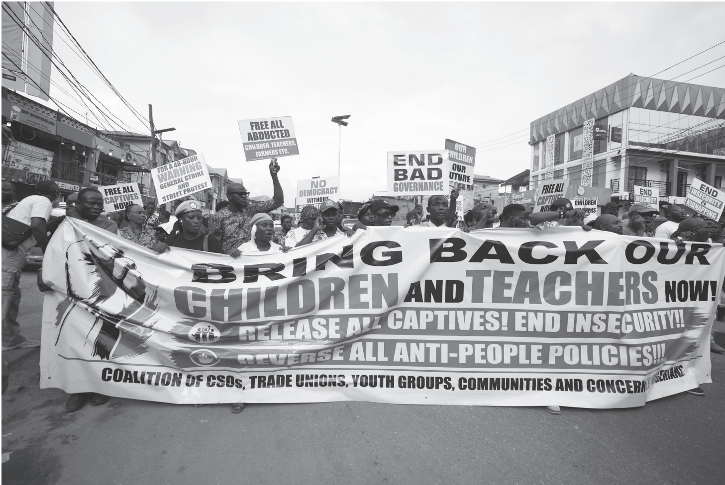
अफ्रिकी देश नाइजेरियाको राजधानी लागोसको सहरमा देशका विभिन्न भागमा सशस्त्र समूहहरूद्वारा अपहरित विद्यालयका विद्यार्थी र शिक्षकहरूको उद्धार गर्न सरकारसँग माग गर्दै विरोध प्रदर्शनमा उत्रेका जनता जून १२, २०२६ का दिन । भ्रष्टाचार, कुशासन, अपहरण, हत्या र सशस्त्र विद्रोहहरूका कारण नाइजेरियाली जनताको जीवन कष्टकर बन्दै गएको बताइएको छ ।

★ वर्ष : २८ ★ अङ्क : १४२ ★ ने. सं. ११४६ अनला गा, चतुर्दशी ★ आइतबार ★ ३१ जेठ, २०८३ ★ June 14, 2026, Sunday ★ मूल्य रु. ५१- ★ पृष्ठ ८