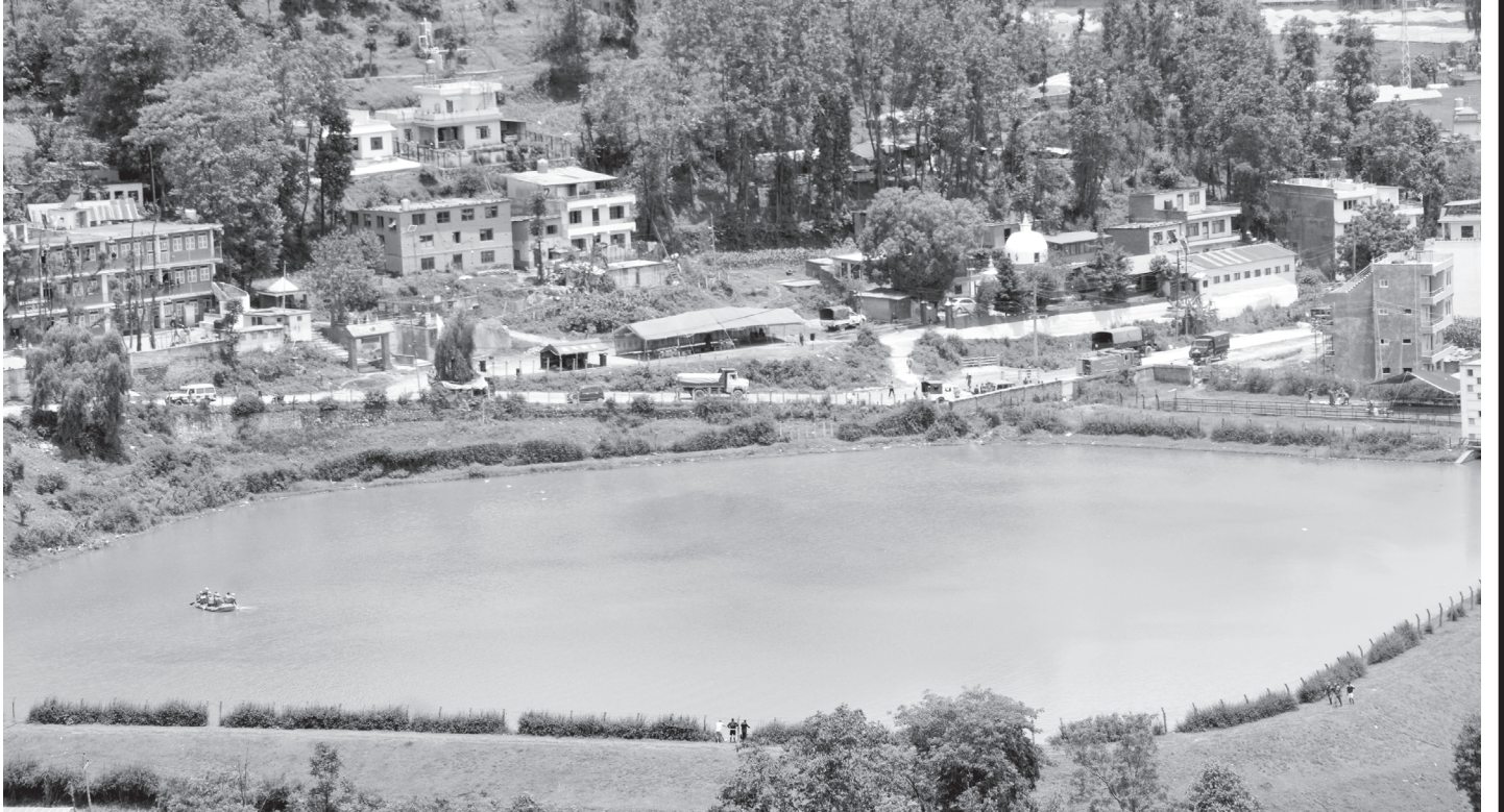
पनौती जलविद्युत् केन्द्रको बाँध : काभ्रेपलाञ्चोकको पनौती नगरपालिका-११ को थुम्कीडाँडाबाट देखिएको पनौती नगरपालिका-१० खोपासीस्थित पनौती जलविद्युत् केन्द्रको बाँध र आसपासको क्षेत्र ।

यी प्रशोधन केन्द्र सञ्चालनमा आएपछि बागमती तथा यसका सहायक नदीमा प्रत्यक्ष रूपमा मिसिने फोहोरपानीको मात्रा घट्ने, नदीको पानीको गुणस्तर सुधार हुने तथा वातावरण संरक्षणमा महत्त्वपूर्ण योगदान पुग्ने अपेक्षा गरिएको छ ।