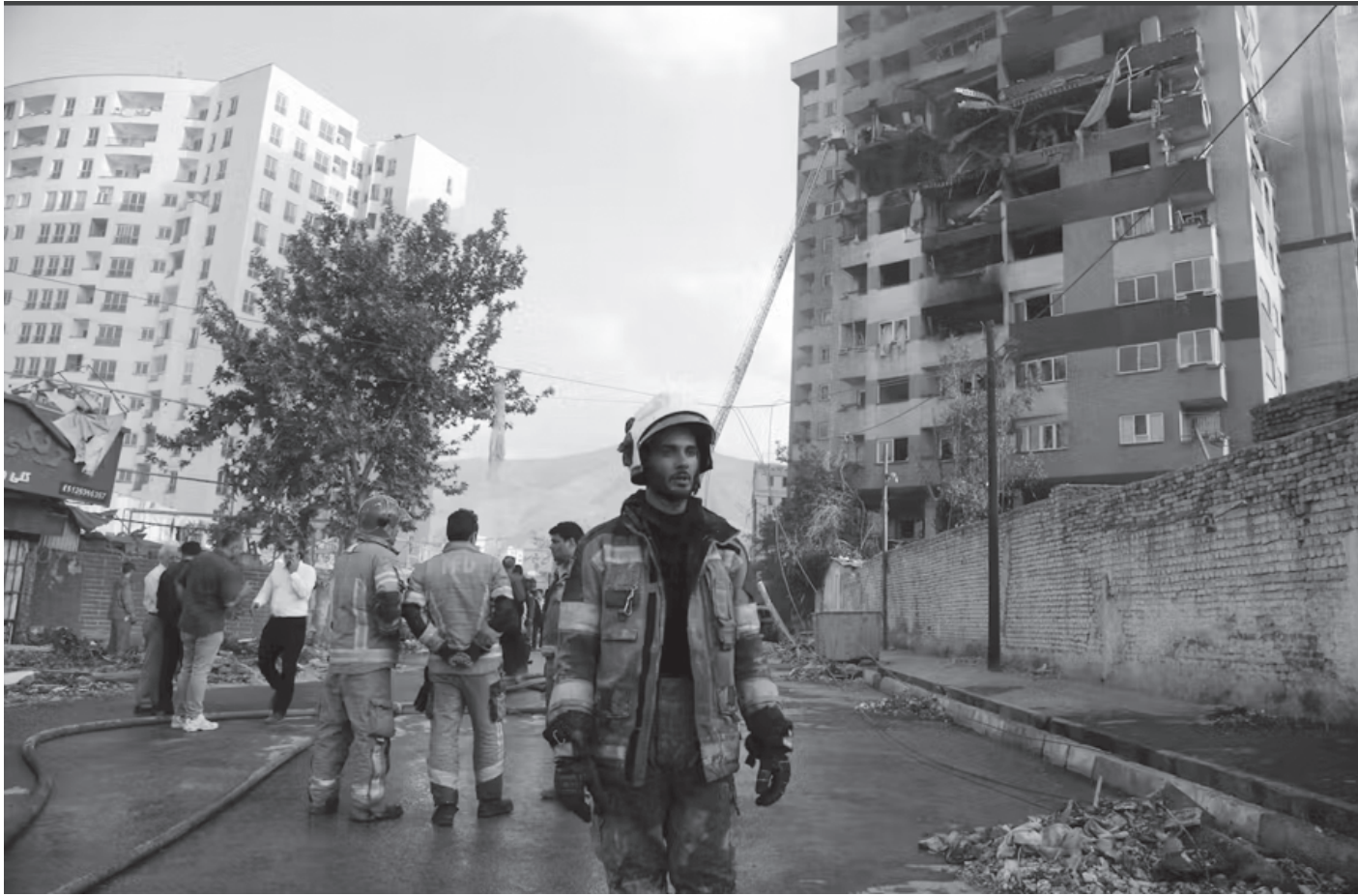
इरानको राजधानी तेहरानमा इजरायली आक्रमणबाट आगलागी भएको भवनमा आगो निभाइसकेपछि इरानी अग्निसमन कर्मचारीहरू जून, १३, २०२३ का दिन। इरान-संरा अमेरिका वार्ता सम्झौतानजिक पुग्दा युद्ध भड्काउन इजरायलले इरान र लेबनानमाथि आक्रमण गरिरहेको छ।