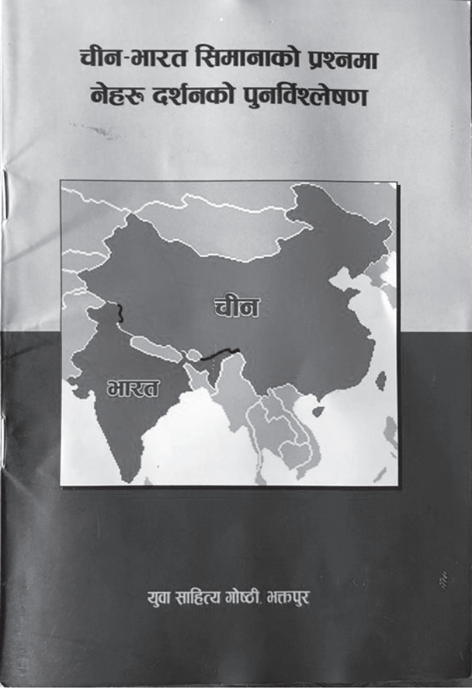
युवा साहित्य गोष्ठी अहमपुर